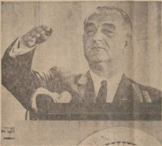
Prez. Johnson pasakoja. — Šeštadienį prezidentas Johnsonas sušaukė į Baltuosius Rūmus korespondentus paskelbti keletą vyriausybės nutarimų ir atsakinėti į jų klausimus vidaus bei užsienio politikos klausimais.

Iš tų keturių valstybių, kurios turėtų garantuoti Kambodijos neutralumą, Pietų Vietnamas yra linkęs dalyvauti, taip pat Laosas, žinoma, ir Amerika. Bet atkakliausiai tuo tarpu priešini ai Tailandas. Kai praeitą rudenį mirė jo premjeras marš.