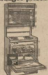
Model FPI-30T, 30 cu. ft., 4 colors or white