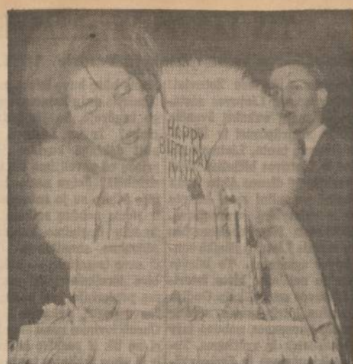
Lynda Bird Johnson, prezidentės vyresnioji duktė, ašvenė 20-ą gimtadieni.

Per pirmąsias kovo 20 dienu Chicago mokyklose įvyko 16 mokytojų apkilimų, daugiausiai iš pačių mokinių pusės.