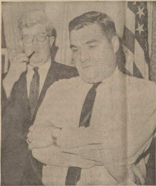
Baltųjų Rūmų spaudos sekretorius nuo Kennedžio laiku Pierre Salinger (dešinė) užleido vietą senam Johnsono pagalbininkui George Reedy (kairė), o pats išvažiavo į Kaliforniją rungtis su kitais demokratais dėl nominavimo į senatą.