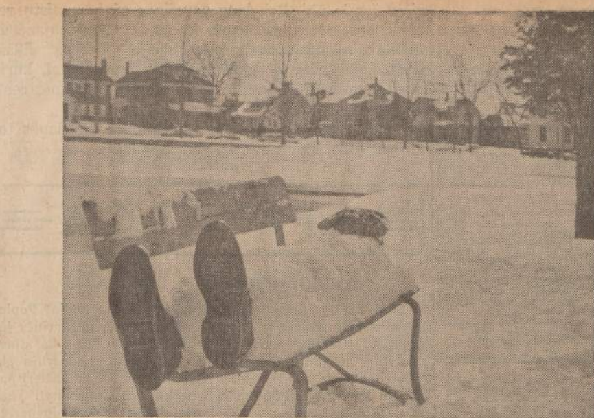
Fotografu išmislas. — Jis padėjo ant apsnigusio suolo batus ir kepurę Fort Wayne, Ind., parke, primindamas "bumams", kad gulėti parkuose dar pavojinga, nors pagal kalendorių pavasaris jau prasidėjo.

Sovietai neišpasakytai giriasi tariamai gausiomis statybomis Lietuvoje, bet žmonės kritiškai įvertina jų propagandą. Būtų tačiau netiesia tvirtinti, kad statybų inžinieriai ir architektai nesidžiaugtų savuoju kūriniu, kad žmogus nesidžiaugtų gavęs naują butą, ar, nors tik kambarį. Bet lietuvis ten nelinkęs toms statyboms priduoti kokią tai išskirtiną sovietinės sistemos laimėjimą. Viena, netinka tas pats lyginimo matas šiandien su laikais buvusiais prieš 23, prieš 46 ar ir šimtą metų, kaip sovietai kad, be skirtumo, daro. Ne tas technikos amžius, ne tie turi būti ir statybų tempai. O dėl sovietinių statybų kokybės tai jau tikrai dalykai blogi. Be to, niekas neturi pagundos tvirtinti, kad per tuos 23 metus Lietuvai esant nepriklausomai, statybos Lietuvoje būtų buvusios mažesnės. Anaipolt, Vakarų Europos ekonominė pažanga tvirtina kaip tik atvirkščiai. Pavergtos Lietuvos metų grandinė savo skai-