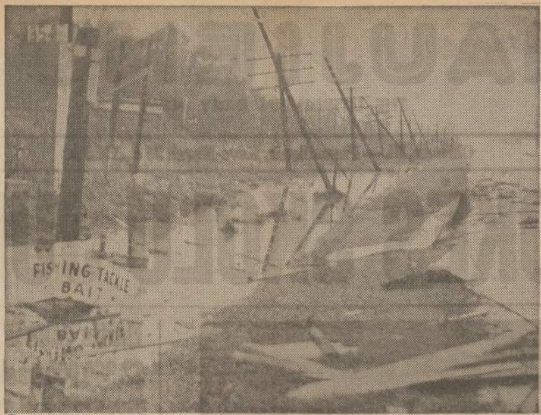
Audros padariniai. — Išvartyti elektros stulpai rodo jėgą, kuria tornadas nusiabė Texaso valstybėj Houstoną ir aplinkines sritis.

Tad šitokios pas mane naujienos, gyvenu viena, nuobodžiauju, nusibodo man ta šiaurė, bet ką padarysi, dar reikia pagyventi. Vakare buvau ligoninėje, aplankiau savo ligonį, o jis nervuotas, piktas, kaip laukinis, rodo, kad dėl mano kaltės jis serga. Jei visi ligoniai tokie, tai