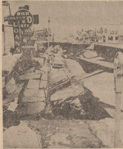
Išlėta virtinė automobilių nugriuvo j 20 pėdų daubą, pasidarėsiu per žemės drebėjimą Anchorage mieste Aliaskoj.

JAV marinų korpo helikopteris rastas sudužęs Luzono salos kalnuose Filipinuose. Jis šeštadienį išskrido su 10 vyrų iš Clark aviacijos bazės j Cubi Point laivyno bazę. Lėktuvai, išsiųsti jo ieškoti, rado visus vyrus žuvus.