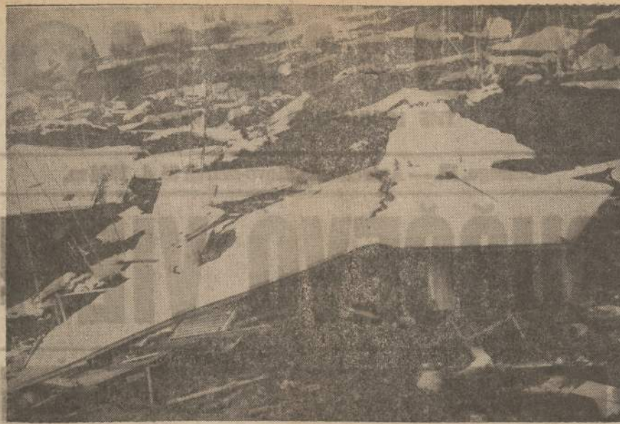
Potvynis po žemės drebėjimo. — Po žemės drebėjimo Aliaskoj Pacifiko pakraščiais nuėjo 5-15 pėdu banga. Ji ypač didelį medžiaginį nuotoliu padarė Kalifornijos miesteliui Crescent City. Sugriovė 150 namų. Žuvo 10-15 žmonių.

In summary, as an American and citizen of Illinois, I suffered gross and inexcusable invasion of my most precious civil and religious