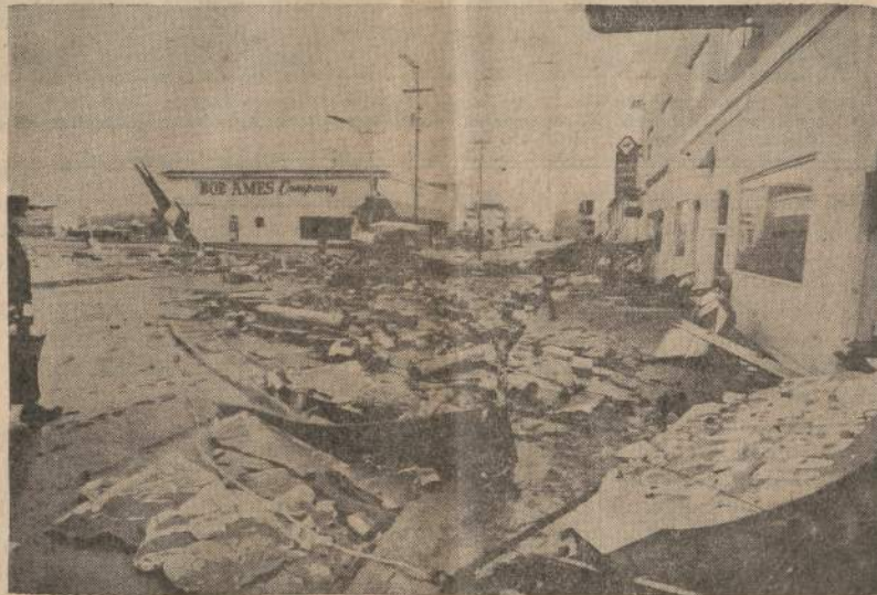
Anchorage po žemės drebėjimo. — Kareiviai patuliuoja po žemės drebėjimo Aliaskos didžiojo miesto Anchorage (100,000 gyventojų) gatvėmis.

• Pietų Korėjos studentai aršiomis, kruvinomis demonstracijomis priverė vyriausybę atšaukti iš Tokijo delegaciją, kuri buvo išsiųsta tartis dėl diplomatinų santykių užmezgimo.