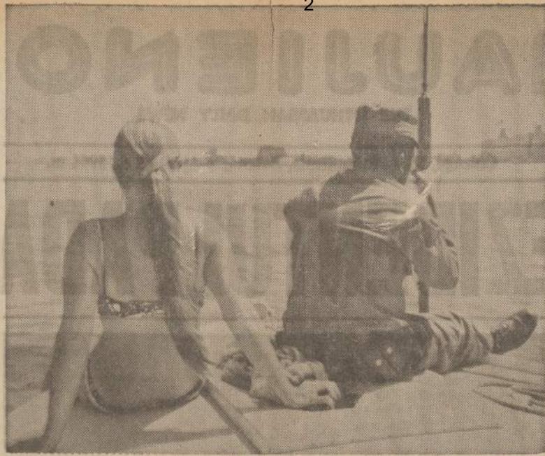
Kaip iš Carmen operos. — Kubos kareivis išfikimais neša sargybą Havanos uoste, žiūri, kad nepabėgtų nuo Castro valdžios kubičiai, nors ir nelengva, jaučiant užnugarį besikaitinančią senortę.

Amerikoniškajame laikraštyje ne sykį pabrėžiama, jog aktorė Rūta Lee-Kilmonytė "nugalėjo" Kremlių — gavo leidimą Lietuvon įvažiuoti ir gavo žodį, jog jos senutę galės išvažiuoti.