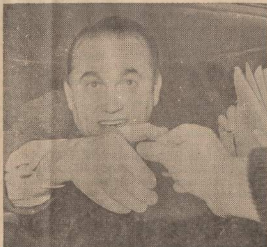
Alabama gubernatorius George Wallace, didelis rasinės integracijos priešas, atvyko politikuoti į Indjaną. Jis dalyvaus pirminiuose balsavimuose kaip demokratų kandidatas į prezidentus. Wisconsin balsavimuose už jį pasisakė 25% balsuotojų, kas reiškė didelį “rasistų” pasisėkimą.