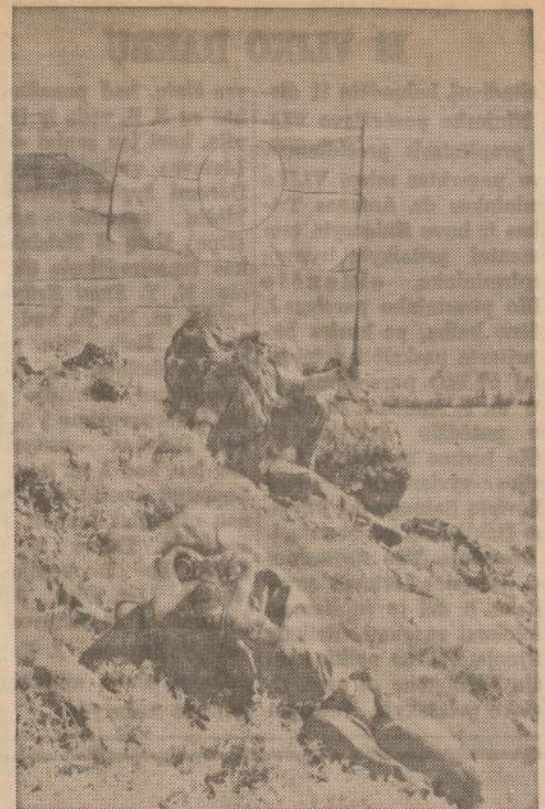
Anglų karsiviai, priklausą Jungtinių Tautų taikos korpei, stebi Kipro graikų kovotojų pozicijas Kirenijos kaimuose.

AUKOKITE PATYS IR PARAGINKITE KITUS AUKOTI NAUJIENŲ MAŠINŲ FONDŲ