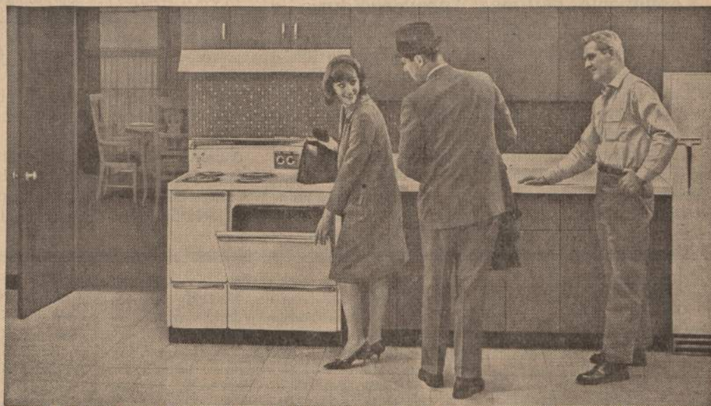
Some of the new features of today's electric ranges: Easy to clean ovens • Eye-level design • Automatic self-cleaning surface units • Full capacity conveniences outlets • Rotisserie • Automatic roast thermometer • Programmed cooking • High Speed Surface Cooking • Instant High Speed Broiling

Now-get the wiring free when you install new electric ranges