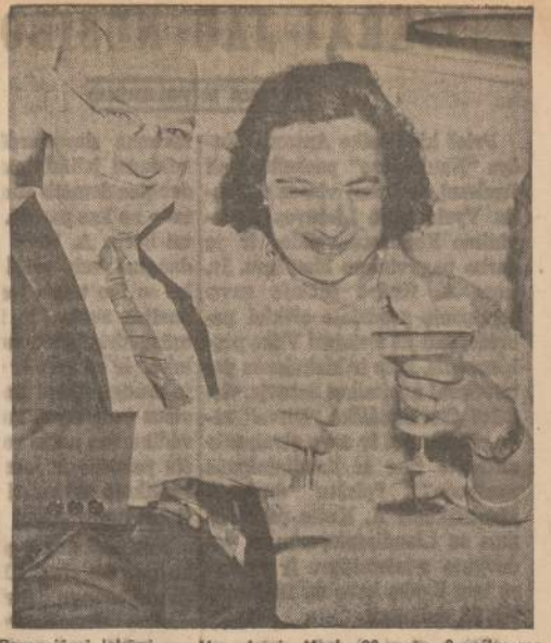
Pagarbėjusi lakūnė. — Mrs. Jerrrie Mock, 38 metų, 3 vaikų motina, geria su tėvu šampana, grįžus namo į Columbus, Ohio, po laimingos keičionės lektuvu aplink pasaulį. Ji skrido viena vienmoteriu sportiniu lektuvu Cessna.