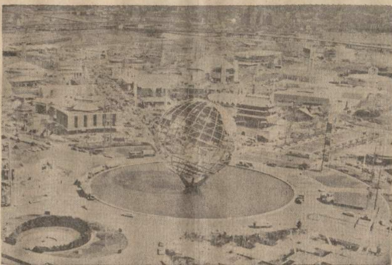
Pasaulinės parodos vaizdas. — Nuotrauka, daryta iš helikopterio, rodo vaizdą pasaulinės parodos New Yorke (Flushing Meadow). Paroda bus atidaryta trečiadienį, balandžio 22 dieną.

Konferencijoj Kinijos komunistai ir jų rėmėjai gali pareikalauti balso ir galios pagal komunistų skaičių, ne jų partijų. Chruščevą palaiko komunistų partijų dauguma, bet Pekingas gali pasigirti, kad jo pusėj yra daugiau komunistų: Kinija turi 17 mil. narių, Indonezija — 2 mil.