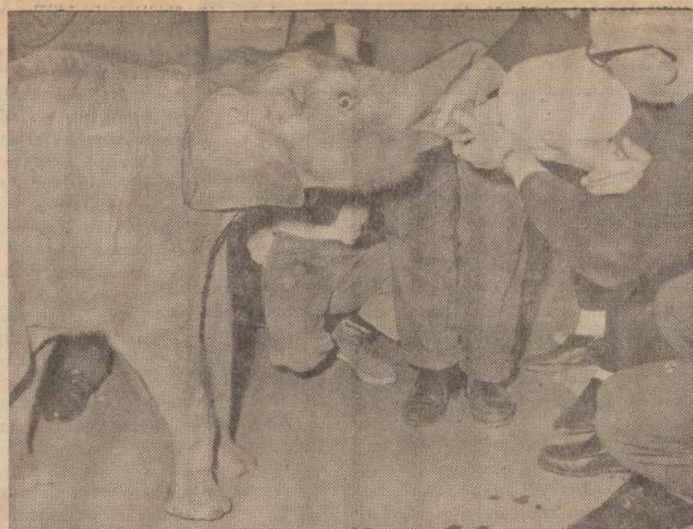
Litiputiškas dramblys žiulpia iš butelio pienu Erie, Pa., zoologijos sode, ką tik atgabentas iš Azijos. Jis yra pats mažiausias dramblys Amerikoje, tik 3 pėdų aukščio.

Vieni savo kritika niekindami pačią instituciją ir dažnu atveju joje su pasišventimu ir asmeniniu pasiaukojimu dirbančius veikėjus, siekia pateisinti savo nepagalvotus praeities žygius ir sprendimus, o kiti tvirtai stovėdami už šios institucijos išlaikymą ir gindami jos savo darbu