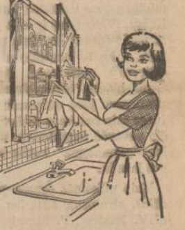
Savo namine vaisty spintelė roikia nepaprastai įvairiai ir tvarkingai užlaikyti, kaip šiame vaizdelyje parodyta: šimti visos bonkutes ir išmargoti lentynas; patikrinti visus užrašus, kad neįvyktų klaidų, nes vaisty su maistymas gali būti fatališkas, patikrinti, kokiu vaisty trūksta ir juos papildyti kad būtų bet kokiam netikėtumui pasiruošęs.

Į tomą (Rytų Lietuva) dar galima užsisakyti prenumeratos kainą, po $10. Užsakymus patogiausia siųsti tiesiai į leidyklą — Lietuvių Enciklopedijai, 265 C Street, So. Boston, Mass. 02127. Vėliau, perkant per knygų platintojus ir knygynus, kainą, savaime suprantama, bus aukštesnė. Leidėjas J. Kapocius, atvažiavęs į Chicago ir suruošęs Chicago lietuvių spaudai ir knygoms mylėtojams bei platintojams draugišką pobūvi su šaunia vakariene Lietuvių Auditorijoje, paaiškino, kaip yra galima knygai jau išėjus ją užsisakyti dar prenumeratos