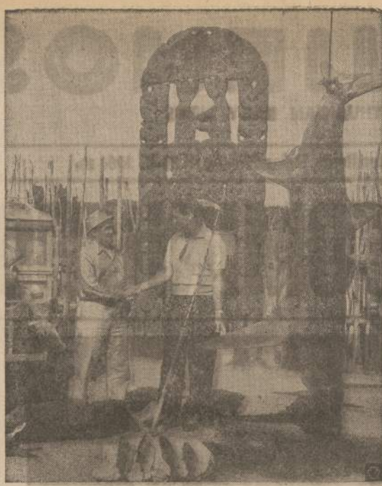
Beisbolo žvaigždė Ted Williams (dešinėje) žaidžiamas Naujojoje Zelandijoje pagavo 587 svary ryklį, sumeiskeriojo viena trijų svary upėtakį ir nušovė dvi stjrnas — visa tai per 3 valandas ir 25 minutes laiko...