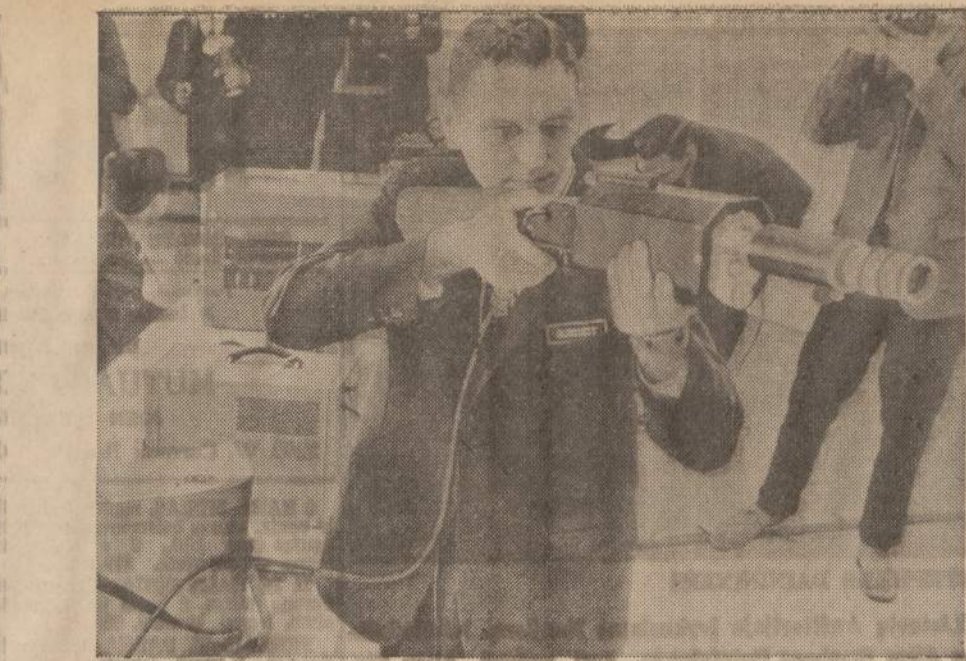
JAV kariuomenės inžinieriai bando naują šautuvą, kuris į taikinį siunčia ne kulkas, bet spindulius.

APDRAUSTAS PERKRAUSTYMAS... 2022 W. 69th Chicago 36, Ill. Tel. WAlbrook 5-9209