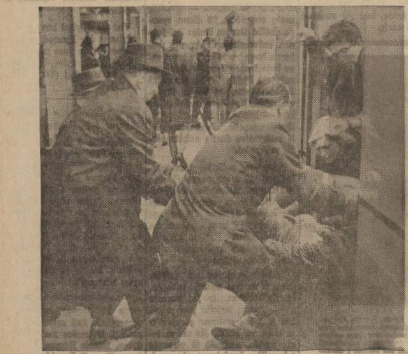
Veizdas iš pilietinių teisy demonstracijų New Yorke pasaulinės parodos atidarymo proga. Policininkai traukia iš traukinio demonstrantus, kad galėtų uždaryti duris. Durų ne-uzdarius, traukinys negali pavažiuoti.