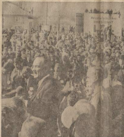
Prezidentas Johnsonas iš Chicago atskridęs į South Bend, Ind., kur šiuo metu yra daug bedarbių, kalba apie sumanytą darbininkų apmokinti, kad tikyt dirbti naujųjų laikų modernioje pramonėje.

Prezidento Johnsono pranešimas reiškia apgaule, skelbia Pekingo laikraščiai. Jie įrodinėja, kad atominis žaliavų gamybos sumažinimas nevaržys Amerikos pasiruošimo branduoliniam karui.