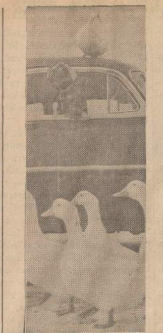
Denver, Colo., antis, nepanorėjusi žingsniuoti kartu su kitomis savo serimis, užsako ant automobilio. Automobiliję važiuoju vaikas stebisi, kas tas neprašytas keleivis planuoja.

damas atsišaukimą vien vokiečių kalba ir įsakdamas tą atsišaukimą išlaidyti gatvėse: "Klaipėdos krašto gyventojai! Didokas skaičius civilių asmenų ("Freishealler") įsiveržė į Lauksargių stotį. Kai po Santarvės Valstybių atstovas aš priešinsiuos visomis turimomis priemonėmis prieš krašto neliečiamybės sulaužymą. Kviečiu gyventojus laikytis ramybės ir atsiduoti savo užsiėmimui ir savo darbiui. Santarvės valstybių man pavestą postą aš neapleisiu. Petisnė".