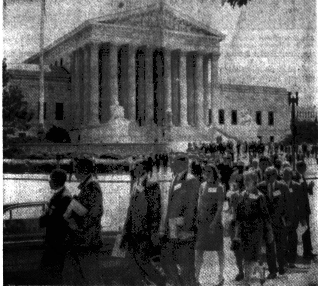
Protestantų dvasininkai su žeimomis, pasimeldę prie JAV aukščiausiojo teismo rūmų, sudėjus 10 metų nuo sprendimo integruoti mokyklas, nuėjo prie Kapitolio paveikti senatą, kad jis priimtų pilietinių teisių bilį.

Amerika už tai rodo didelį norą padėti Rumunijos komunistams, pritaikyti prekybą, ekonominio bendradarbiavimo principus ("most-favored nation"). Šiuo drauginamo principu tuo tarpu naudojasi dvi komunistų valdžios — Jugoslavijos ir Lenkijos.