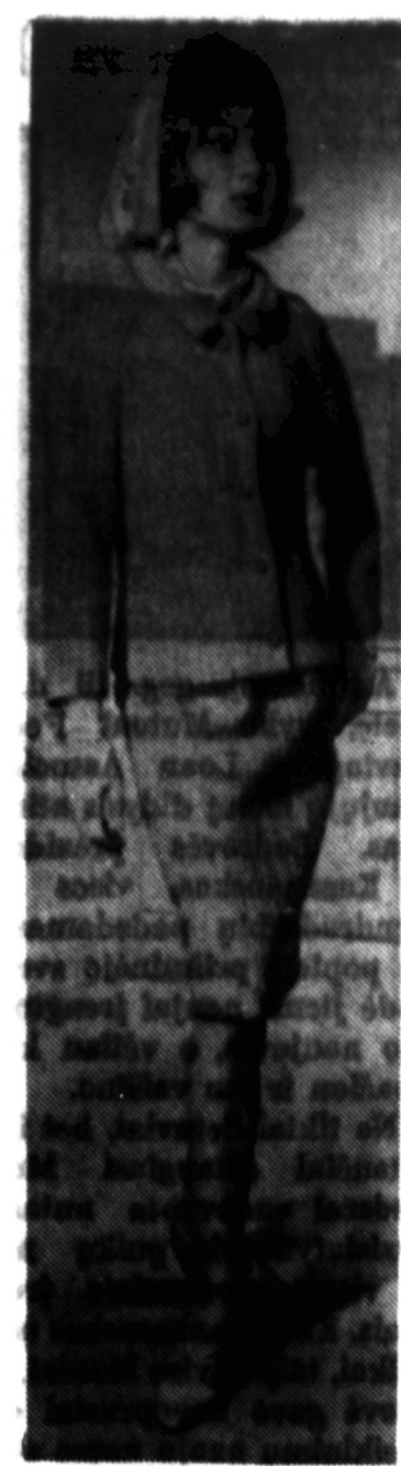
Naujasis Paryžiaus mados gamintojas... Paryžiaus mados gamintojas...