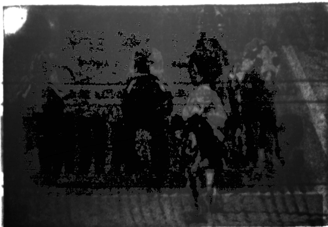
Žings Northern Dancer, šimėje pirmą vietą Kentucky Derby lenktynėse, pralenkė visus var-žovus ir Philadelphia lenktynėse. Jo savininkas uždirbo $150,000 premiją.

Didelė, graži šv. Jurgio baž-nyčia, kurią vargani Detroito lie-