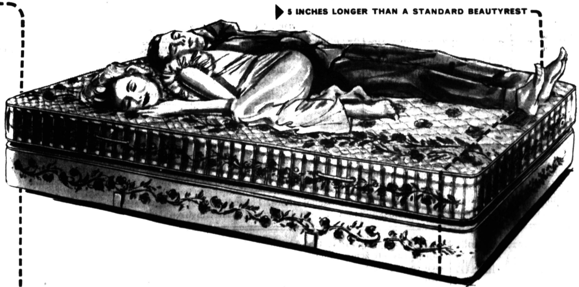
▶ 5 INCHES LONGER THAN A STANDARD BEAUTYREST

OPPORTUNITY! Replace your old mattress with a Beautyrest Long Boy . . . Get out-of-this-world comfort! . . . Get room for your feet . . . SAVE $20