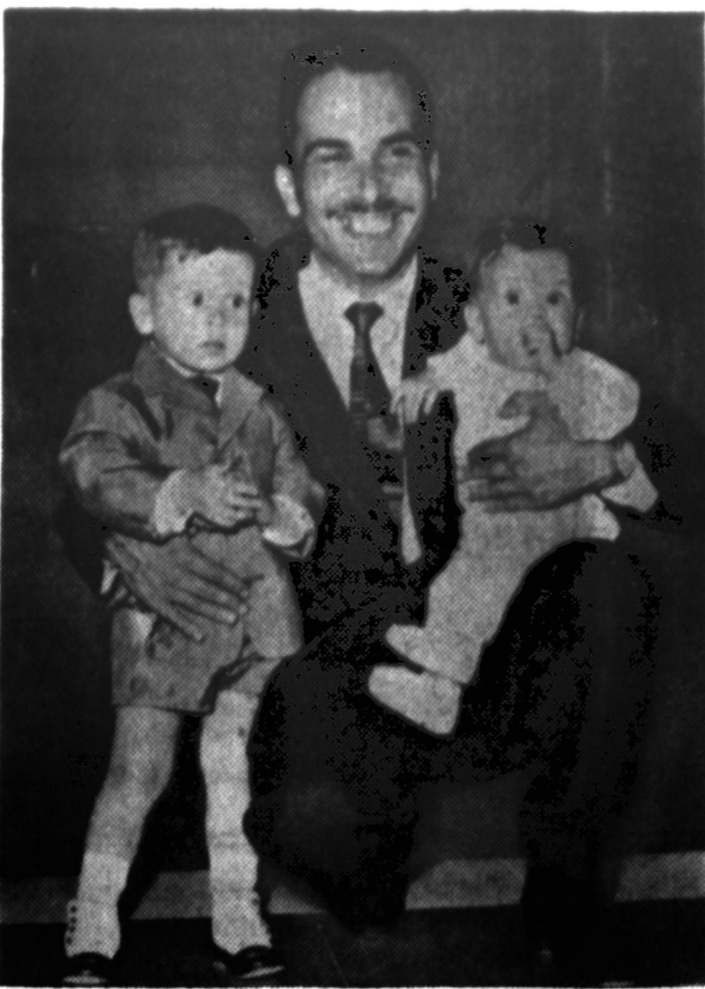
Jordanijus Karalius glamonėja savo vaikus, kunigaikštį Feisalą ir kunigaikštę Abdulą.