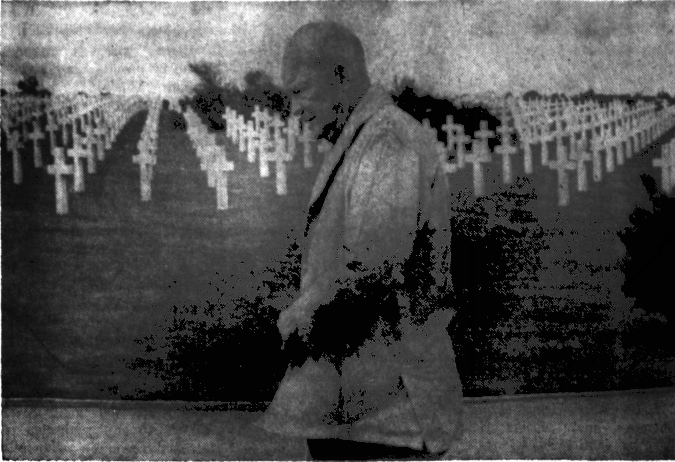
Karo vadas tarp žuvusių tautiečių. — CBS filme apie amerikiečių, anglų išsikėlimą į Prancūziją 1944 m. bir- želio 6 dieną yra ši scena, rodanti vyriausią sąjungininkų vadą generolą Dwight D. Eisenhower amerikiečių karių kapinėse St. Laurent, Prancūzijoje. Ten yra palaidota 7,000 Amerikos karių.

Pagal taikos sutartį, pasira- šytą 1962 m. Eviane, abiejų ša- lių piliečiams buvo užtikrinta laisvė keliauti, prancūzams į Al- žeriją, alžeriečiams — į Prancū- ziją.