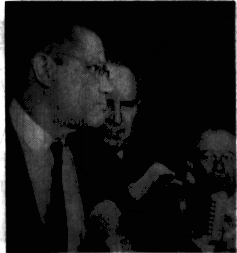
Gyvybos sekretorius McNamara (kairė) ir Štoby vadų tarybos pirmininkas gen. Taylor buvo auskirdę į Pietryčių Azijos apsaugos reikalų konferenciją Havajuje.

JAV prezidentas Lyndon B. Johnson skubiai susaukto spau- dos konferencijoj pirmadienį pa- linkėjo naujam Indijos vadui pasisekimo.