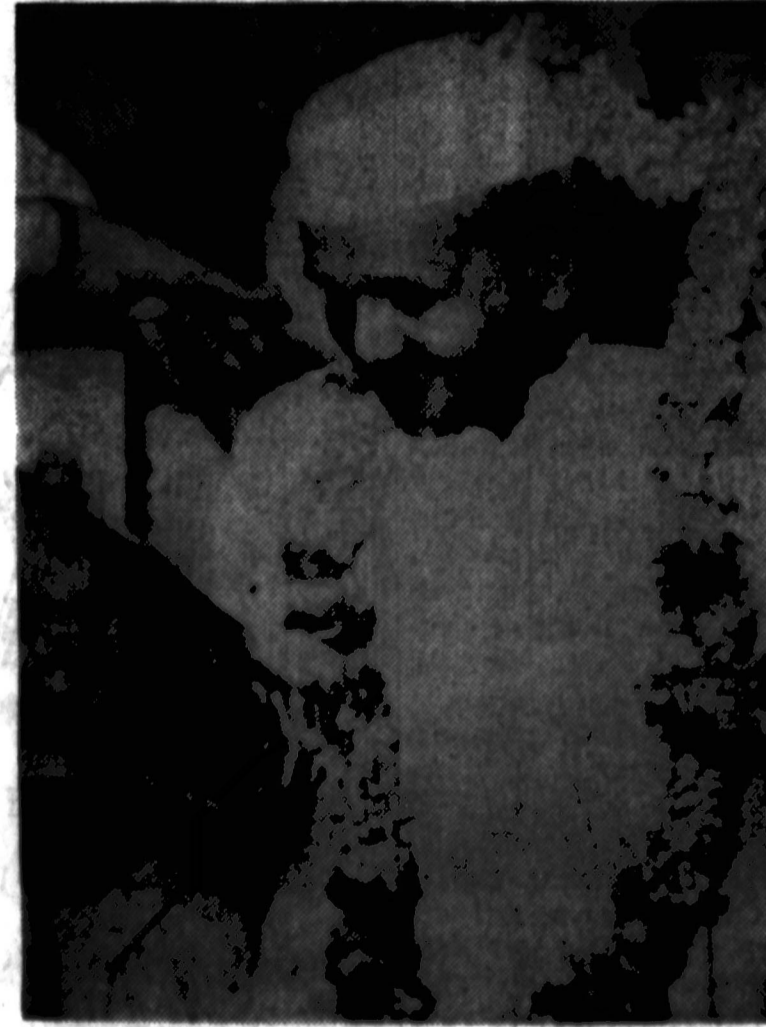
Lal Bahadur Shastri išrinktas Indijos vyriausybės vadu mirus Nehru. Po išrinkimo partijos (kongreso) frakcijos susirinkime jam užkabino girliandų vainiką.