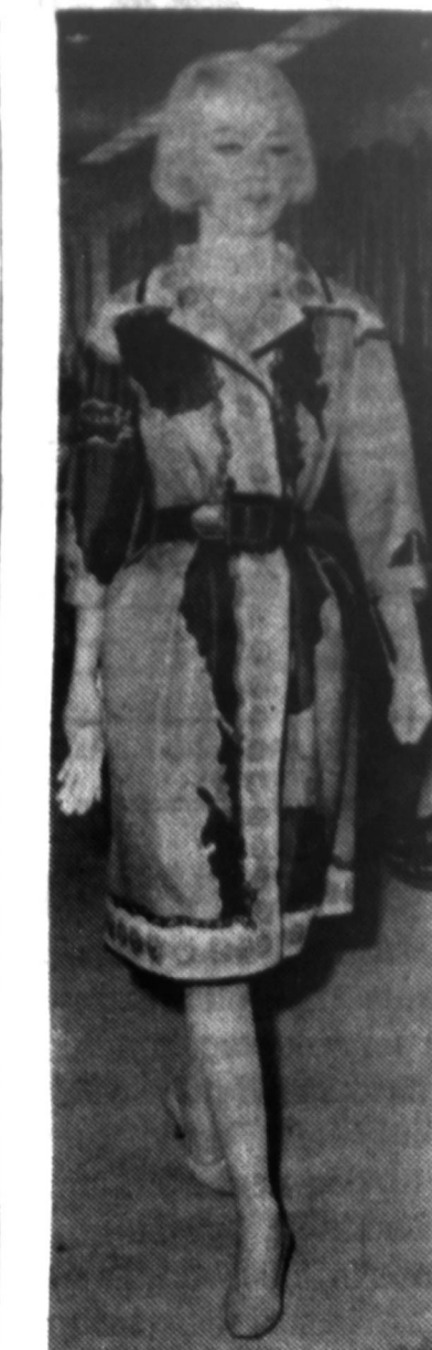
New Yorko naujusiosiomis suknelių madomis tapo šilkinės suknelės su žemėlapiais. Mėgiamausi yra pietų Amerikos saulėti vaizdai. Paveikslė matome žemėlapinius šilkinės apsiūdusią panelę.