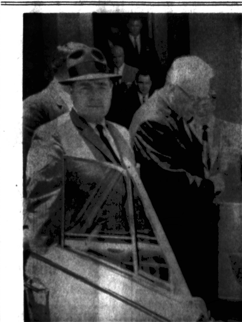
JAV aukščiausio teismo pirmininkas Earl Warren, vedovaujantis komisijai širti prezidento Kennedžio nužudymo aplinkybes, buvo atvykęs į Dallas miesto kalėjimą apklausti Jack Ruby. Ruby buvo nužudytas mirus bausmės už nužudymą Lee H. Oswald, įtarimo prezidento žudiko.

Vakarų Vokietijos kanceleris Dr. Ludwig Erhard išskrido į Kanadą ir Ameriką. Ketvirtadienį jis pasakys kalbą Harvardo universitete. Penktadienį atskris į Washingtoną ir išbus 2 dienas.