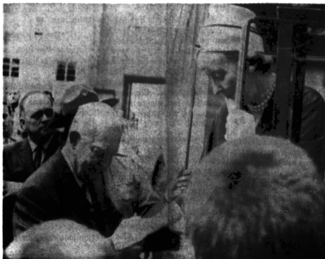
Buvęs prezidentas Eisenhoweris ir ponis atvykę į gubernatorių konferenciją Clevelande pasakytį kalbą ir pasitarti su respublikonais gubernatorių partijos kandidato į prezidentus klausimais.

Roberto Arias yra britų primabalerinos Dame Margot Fonteyn vyras. Apie jį buvo daug kalbama ir rašoma 1959 metais, kai jis ruošė į Panamą viziją valdžiai nuvesti. Bet teismas 1960 metais jį išteisino.