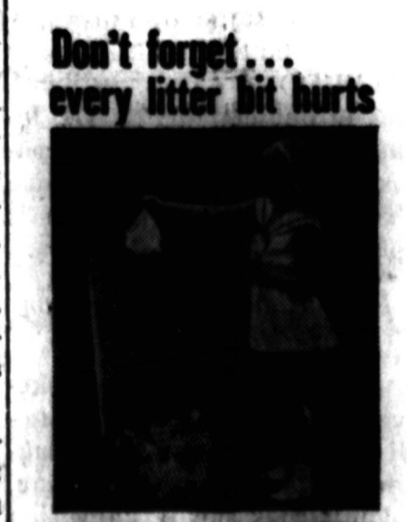
Don't forget... every litter bit hurts

Sėja, Nr. 2 (86) 1964 m. kovo — balandžio mėn. XII metal. Leidžia Varpininkų Leidinių Fondas, redaguoja Edvardas Boringas, ir t. t. Turinyje A. Mingio (deja, slapyvardis): Galime ir turime pasiekti milijoną! (Tai