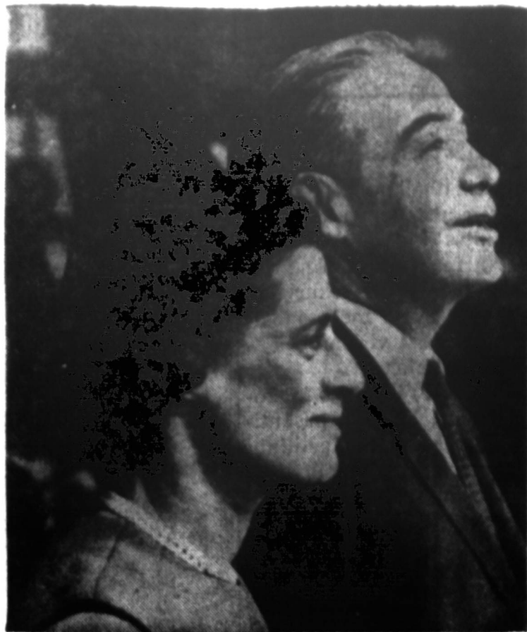
Pensilvanijos gubernatoriui Wm. Scrantomui ir poniam Connecticut Respublikonų suvažiavimo dalyviai Harforde iškėtė ovacijas.

10. Labai pageidaučiau, kad šioje telegramoje numatytas sprendimas įvyktų nuo skubiausiai, nes lenkų-Sovietų byla kečia nerimą viešoje visuomenėje bei parlamento sluoksniuose ir gali sudaryti rimtų sunkenybių ne tik tai Jo Didenybės Karaliaus Vyriausybei, bet apamai visoms Jungtinių Tautų karo pastangoms. Prašau Tamstą pranešti, ar Tamstai priimtinas šitasai susitarimas kaip sprendimas. Turiu Tamstai, Pone, pasakyti, kad būtų man labai neramu dėl įspėdžio, kuris paveiktų viešąją opinią čia ir visur Jungtinėse Tautose, jeigu pranešimas visuomenei dėl pasiekto susitarimo ne-