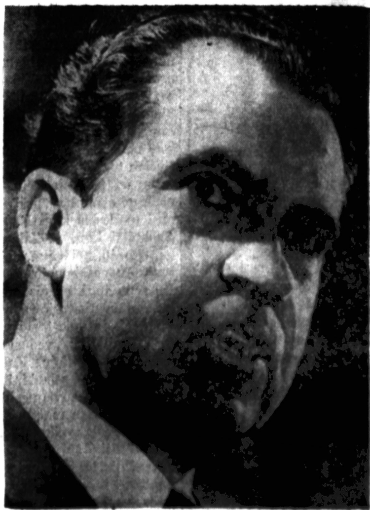
Buvęs viceprezidentas R. Nixon Wisconsin respublikonų suruošty pietų metu (po $100 vienam asmeniui) pareiškė, kad jis pats išėjo iš varžybų dėl viceprezidento posto.