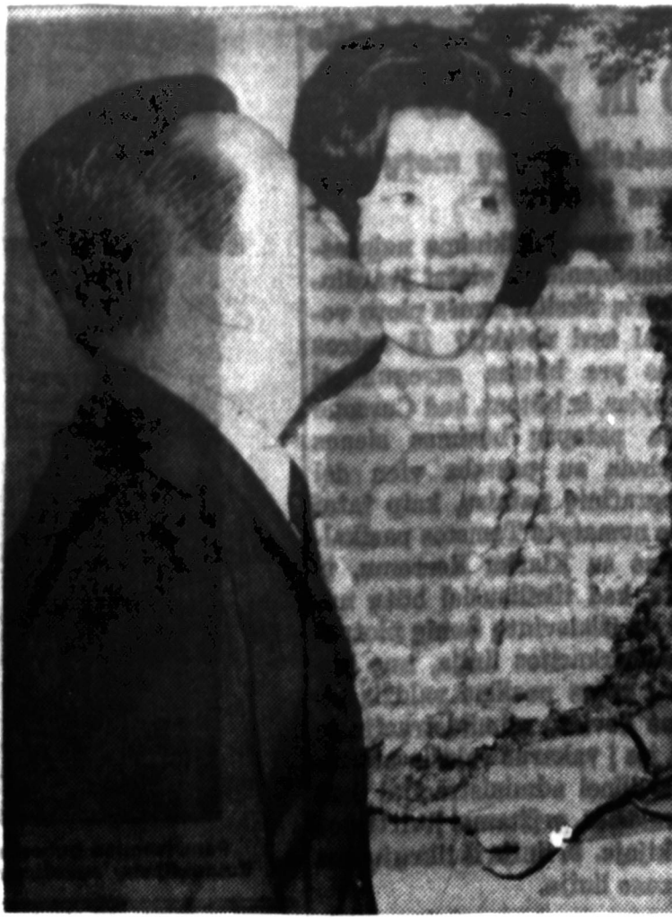
Prezidentė dukterė Linda Bird Elydi Havajų delegaciją. Senatorius D. K. Inouye atsiveikindamas būtuoja Linda.

bių, kad, eidami į rinkimus su kandidatu Goldwateriu, republikonai bus sumušti rinkimuose ir į kitas valdines vietas: į JAV senatą, atstovų butą, gubernatorių, valstybių legislaturas (seimus) ir t. t. Tai būtų partijai smūgis, nuo kurio ji vargiai beatsigautų. Paskutinė jų viltis — tai Pensylvanijos gubernatoriaus William W. Scranton. Jisai ryžosi kandidatuoti prieš savo norą, nes kito kandidato, kuris galėtų suvienyti nuosaikiųjų republikonų jėgas prieš Goldwaterį, jie nemato. Jisai ir pats abejoja, ar ne pervelai jisai stoji į kovą, bet, užsidėjęs ant pečių našta, jisai jau nebegali ją mesti. Senatoniai, gubernatoriai ir gen. Eisenhoweris jį skatina ir žada visomis jėgomis remti. Bet tai ne entuziazmo nuotaika, o desperacijos. Balsuotojų masių ji neuždegs.