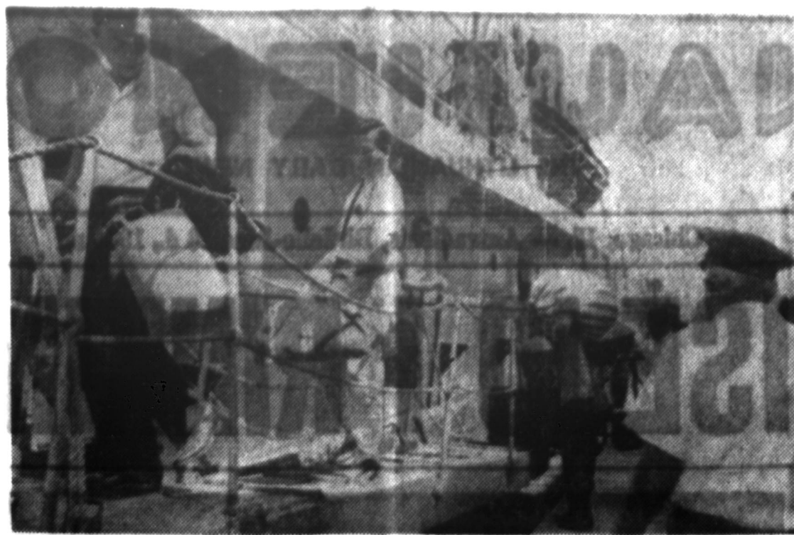
Kinai iš Hongkongo lipa Honolulu uoste į laivą "Pomona" (lirinkų pareigoms). Pakelviui iš Amerikos buvo nužudytas laivo kapitonas, norvegas. Visi (lirinkai po to atsiskė toliau plaukti "Pomona" (lirinkai buvo 5-6 teutybių, laivas priklausė brazilams, bet plaukė su Libėrijos vėliava.