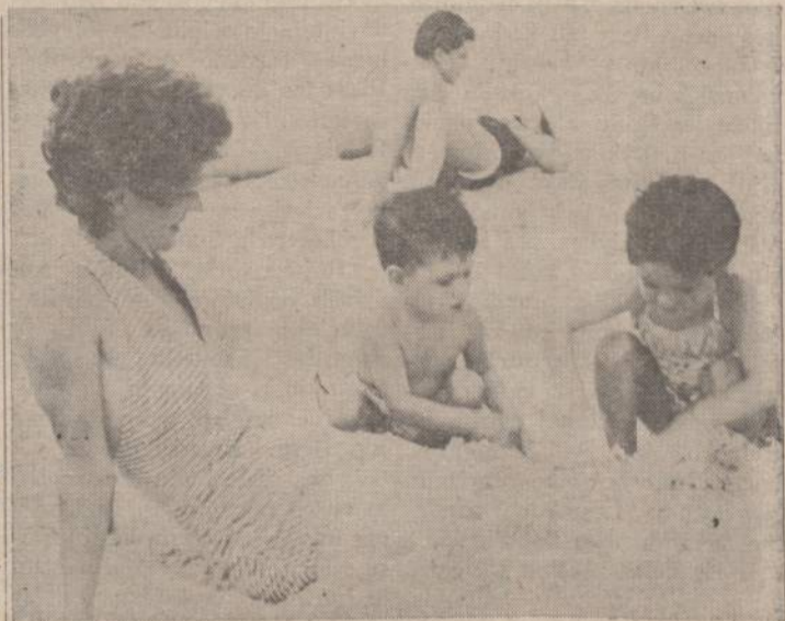
Saulės vonios atostogaujant...