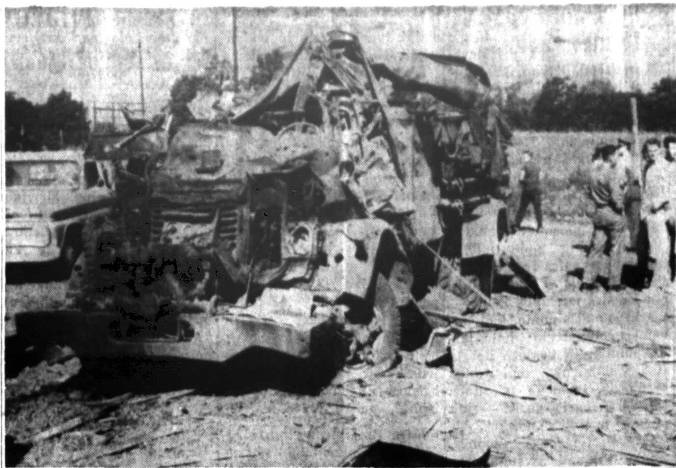
Marshall's Creek, Pa., apylinkėje uždėgė parak veis sunkvežimis. Tuojau buvo išaukti gaisrininkai deginiai malinai užgesinti. Nesėję atvažiuo gaisrininkai pradėti darbo, parakas sprogo ir užmūso tris gaisrinikus. Paveiksle matome nukentėjusį gaisrininkų sunkvežimį.