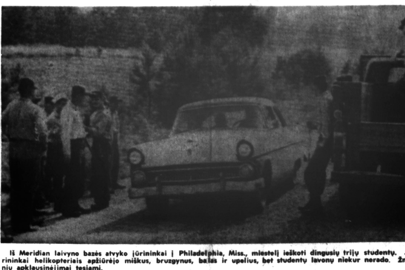
Ši Meridiana laivyno bazės atvyko į Jūrininkai į Philadelphia, Miss., miestelį leikoti dingusių trijų studentų. Jūrininkai helikopteriais apžiūrėjo miškus, bruzgynus, balas ir upelius, bet studentų lavonų niekur nerado. Žmoniai apklausinajimai tęsiasi.