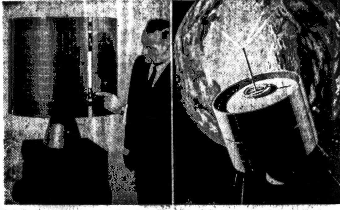
Štai čia "Public Satellite Nr. 1" modelist (kairėje). Dešinėje matome, kaip jis iš tikrųjų išrodys 1965 m. 22,300 mylių atstumu nuo žemės.