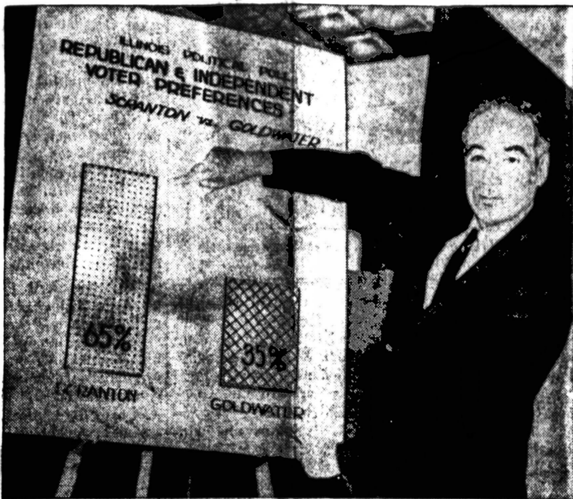
Gubernatorius William W. Scranton optimistiškai nusiteikęs rodo pirštą į skiltį, kurioje atžymėti balsavimo rezultatai Illinois respublikonų konvencijoje.

Praeito birželio mėnesio gale JAV prezidentas Johnsonas Baltajame Name buvo priėmęs ir 4 dienas tarėsi su Graikijos ir Turkijos premjeriais. Kipro krizė kenkia NATO organizacijai, kurios nariai yra ir Graikija ir Turkija.