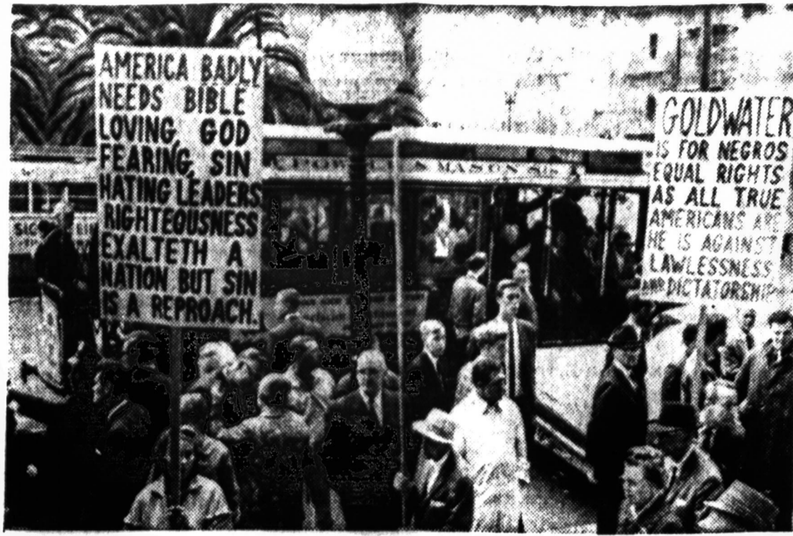
Pirmieji demonstrantai pasirodė San Francisco, kai Respublikonų lyderiai susirinko konvencijos paruošti. Plakatai su religiniais pro-goldwateriniais šūkiu buvo nešiojami ties St. Francis hoteliu.