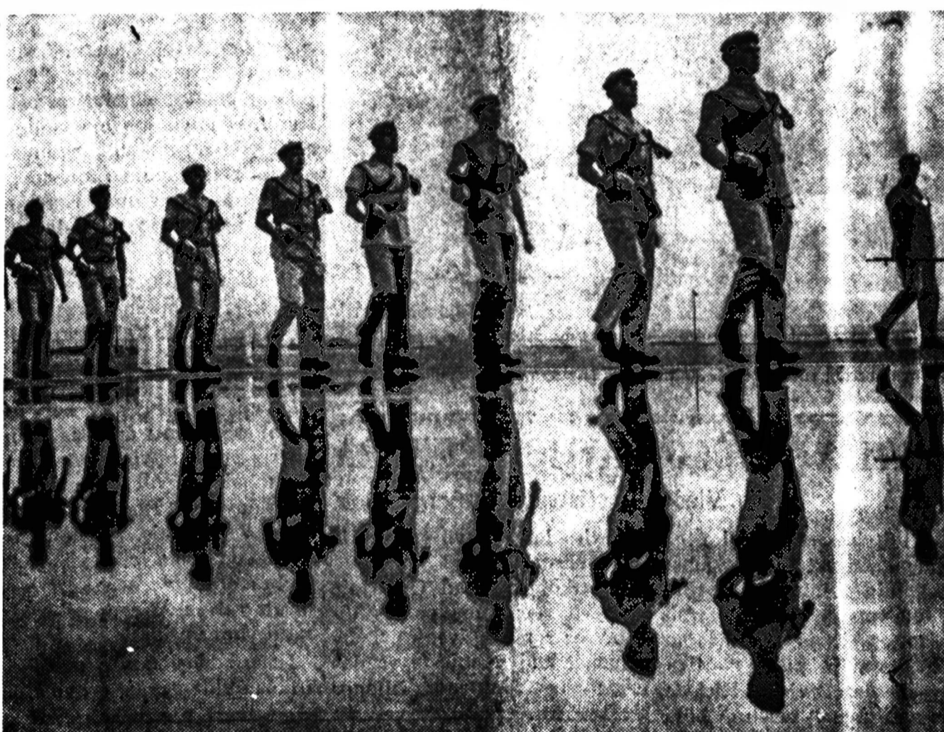
Tylus atspindys. — Trečios Žalių šaulių brigados trimtininkai po lietaus taip tyliai žygiuoja parady aikštėje, Nicosia, Kipro saloje, kad jų žingsniai beveik negirdimi.

Kaltinamojo advokatas teigė, jog jis tai darė dėl to, kad "mylėjęs Prancūziją ir pasaulio taiką".