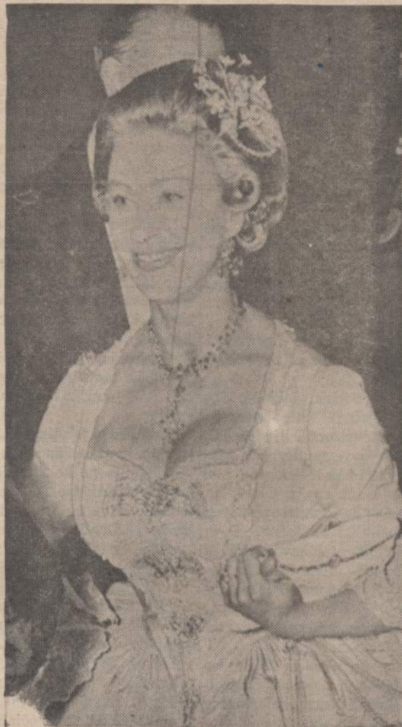
Anglijoje buvo plačiai komentuota dėl balinės georgianinio stiliaus (iš eros prieš 200 m.) suknelės, kurią 18 šimtmečio baliuje dėvėjo princesė Margareta. Jos vyras, lordas Snowden, dėvėjo taip pat atitinkamą kostiumą ir buvo užsidėjęs pudruotą peruką. Balius buvo suruoštas sudaryti fondui šv. Jono karo metu sugriautai bažnyčiai atstatyti.

Kad ir nemokytų, bet jausmais subrendusių mūsų motinėlių pedagogiškas elgesys daugiau padėjo mums asmenybės formuoti, negu kad dabartinių tūlių išsimokslinusių, bet jausmais nesubrendusių motinų vaikams kad padedama. Jausmais subrendusių motinų natūralus jausmas yra tvirtesnis nei pas daugelį silpnų asmenybių inteligentų. Vaikas vaikiškose