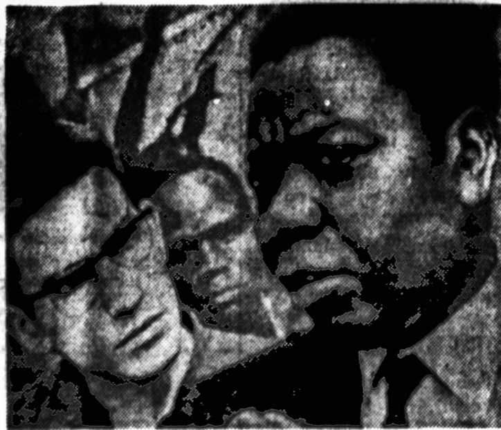
Neseniai grįžęs iš ištrėmimo Moise Tshombe sudarė vyriausybę iš "naujų vyrų". Jis tikisi, kad jis sugebės įgyvendinti taiką Kongo.

Paskelbimas neutralizavimo faktiškai reikėtų atsisąjūdią Pietų Vietnamo, kurį sudorotų iš kitų kraštų siunčiamos komunistų ginkluotos jėgos.