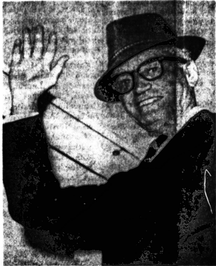
Senatorius Barry Goldwater, kuris pirmąja kovoja dėl kandidatos ir prezidentus, atvykęs į republikonų konvenciją San Francisco, pareiškė: "Nors mūsų laukia sunkūs darbai, bet mes laimėsime".

Franko nuvydė visus, kas tikėjosi iš jo išgirsti, kam jis nori perleisti savo sostą, kai ateis laikas. Missisipi valstijoje dar vienas hotelio savininkas uždarė didelį savo Alkazar hotelį, kad tikrai nereikėtų įsileisti juoduju.