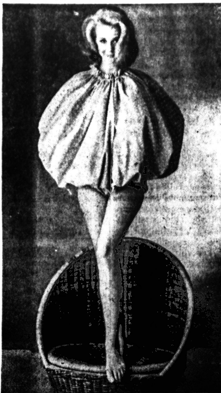
Maudymosi kostiumas, panašus į aviečių spalvos mūlo burbulą, kiek pamarginatą geltonomis dėmėmis, buvo pirmą kartą pademonstruotas New Yorke.

KLAUSIMAS: Aš ir mano vyras gaudavome bendrą čekį. Vyras mirė mėnesio paskutinę dieną. Ar turiu apie tauti tamsai pranešti ar grąžinti čekį, kurį gavau sekančio mėnesio 3 dieną?