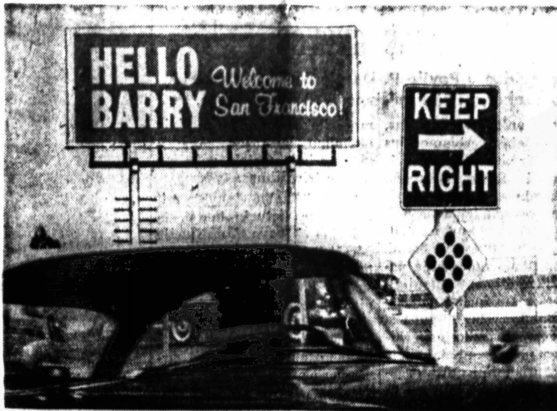
Barry Goldwaterio atvykimas į San Francisco buvo iš anksto paskelbtas didelėje plakatiniame lentoje prie U. S. 101 plento, jungiančio ten aerodromą ir miestą.