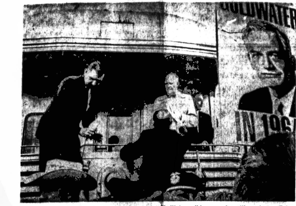
Buvęs prezidentas Dwight D. Eisenhower nuširdiai sveikinamas Amarillo mieste, Teksase, kai ten buvo susijęs trakinys, vežęs dalyvius į San Francisco suvažiavimą, suruoštą tikslu pa- remti Goldwaterio kandidatūrą į prezidentus.

Malcolm X sakosi vykatąs į Kairą, Egiptą, į prasidedančią Afrikos valstybių konferenciją, kur noris ieškoti Afrikos negrų pagalbos, kad galėtų Jungtinės Valstybes apskusti Jungtinėms Tautoms kaip žmogaus teisių laužytojas.