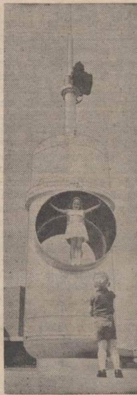
Vaikai žaidimui panaudoja didžiausios pasaulyje alyvos vamzdžių linijos ventilių Houston, Texas.

Vaikui bręstant, keičiasi jo po- linkiai į užsiėmimus — žaidi- mus. Ateina laikas socialiniams žaidimams — lenktynėms. Tokie žaidimai atneša indėlį asmenybės formavimui. Nuo 13 metų prasideda vaiko intelektualiniai žaidimai — kryžiažodžiai, šachmatai, šaškės ir pan. Visi tinkamai atrinkti ir vaiko amžiui bei polinkiams pritaikyti žaidimai turi didelės auklė- jamosios reikšmės. Vaikas turi išsižadėti — tik subręskime tėvai, idant pajėgtume taip svarbiame darbe savo vaikui tinkamai pa- dėti. Bent jau šiandien liaukimės savo vaikui trukdę asmenybę vystyti — nepirkime vaikui šautuvų, traukinių bei kitų panašių gaminų. Vaikui reikia kūrybinės medžiagos žaidimui: tai medžiaga lipdymui,