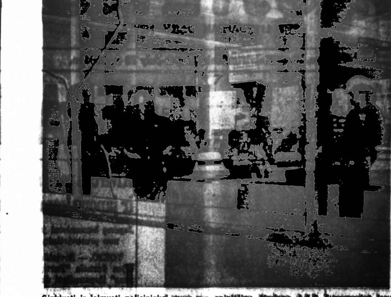
Ginkluoti ir išmuoti policininkai stovėję aplinkui, turėję šautuvus. Laikas buvo sukultas ankstyvą, vėlyvą naktį.

Zinau, kad geras būrys detroitiečių, jeigu ir ne visą savaitę Dainavoje pasilikdami, tai bent tam tikromis dienomis, ypač vakarais, studijų savaitėje dalyvaus, nes progą išklausti toki didelių skaičių kultūrininkų bei