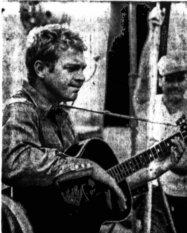
Steve McQueen turi norą pramokti skambinti gitara, nes tai reikalinga jo naujajai rolei, bet pirštai dar nesugeba prisiderinti.

Istatymų vykdymo (policijos) pareigūnai bendrai yra tos nuomonės, kad pirmą kartą nusikaltusiam nuteistam ir vėliau iš kalėjimo "ant parolės" išleistam nusikaltėliui atitinkama priežiūra (supervizija) mažų mažiausiai turi būti trijų metų. Pakartotiniai nusikaltusiam priežiūra turi būti atitinkamai ilgesnė. Tačiau vien pernai 42 nuosimčiai visų Cook apskrities Kriminalinio teismo paleistųjų "ant parolės" negavo net reikalaujamo priežiūros trijų metų minimumo.