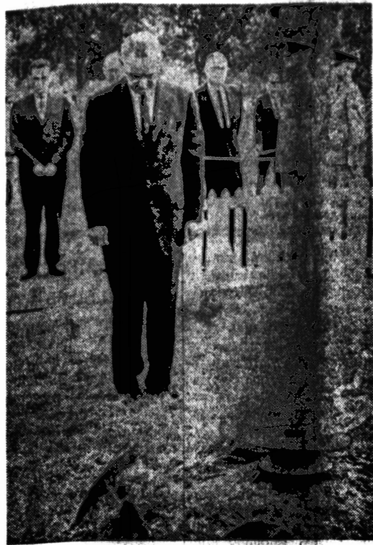
Liūdna atmintis. — Prezidentas Lyndon Johnson po ceremonijų Pentagono stovi nulenkęs galvą ties Prezidento John F. Kennedy kapu Arlingtono kapinėse.

Beje, Ulmanis kelis metus gyveno JAV, baigė Nebraskos universitetą ir ten kurį laiką profesoriavo.