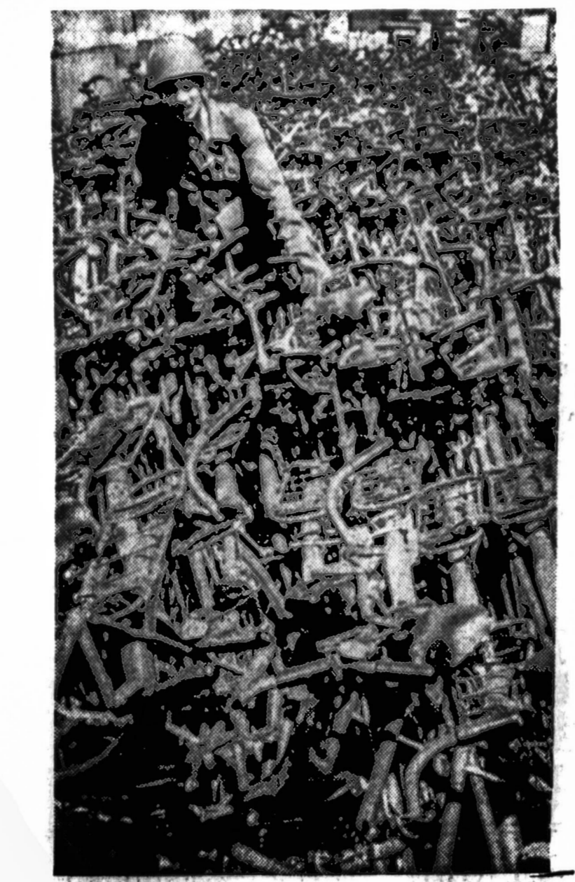
Kaip išnaryti iš dviračių labirinto? Dar sunkesnis klausimas žiūrovui: kokiū būdu vargšas sargybinis pateko į šitą patulinų dviračių labirintą Kipro saloje?

SIUNTINIUS | LIETUVA, TAIP PAT IR MAISTĄ SIUNČIA licenzijuota lietuvių įmonė, registruota U. S. Department of Justice COSMOS PARCELS EXPRESS CORP. MARQUETTE GIFT PARCELS SERVICE 3212 S. Halsted St., Chicago 8, Ill. Tel. CA 5-1864