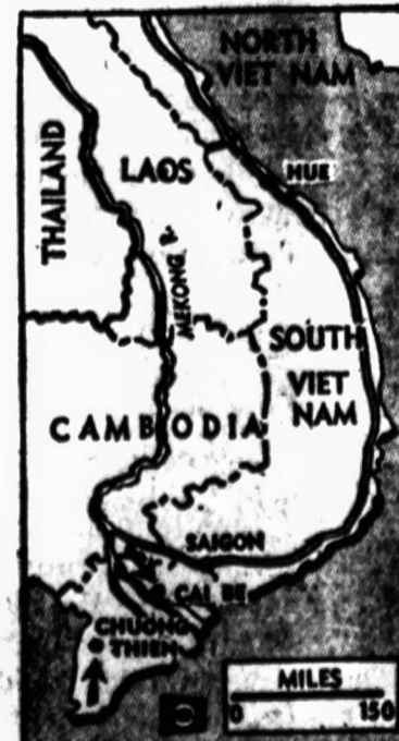
Kovų laukai. — Trys svarbiausieji kariniai susidūrimai įvyko Pietų Viet Name vietovėje Ching Thien ir Cai So, pietuose nuo Saigono.

Šiuo metu visa Kuba rengiasi liepos 26 d. iškilmėms. Kaip ir pas sovietus, jau iš anksto paskelbti šūkių, kuriuos demonstrantai gali užsirašyti ant savo transparentų. Tarp tų šūkių esą ir tokie: "Šalin imperialistų rankas nuo Pietų Vietnamo!", "Te gyvuoja herojiška Venecuelos darbo žmonių kova!" ir pan.