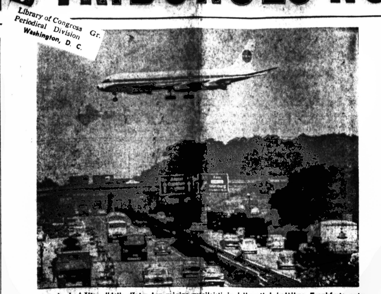
Atrodo, kad šitas didelis džiautas lyg mėgina nusileisti ir įsijungti į judėjimą Frankfurto aerodrome, bet iš tikrųjų jis nusileis netoli esančiame aerodrome.

Penktadienį, liepos 24 d., Prezidentas susitiko taip pat su daugeliu JAV darbo vadų ir unionų veikėjų. Bus aptarti darbininkų teisės klausimai.