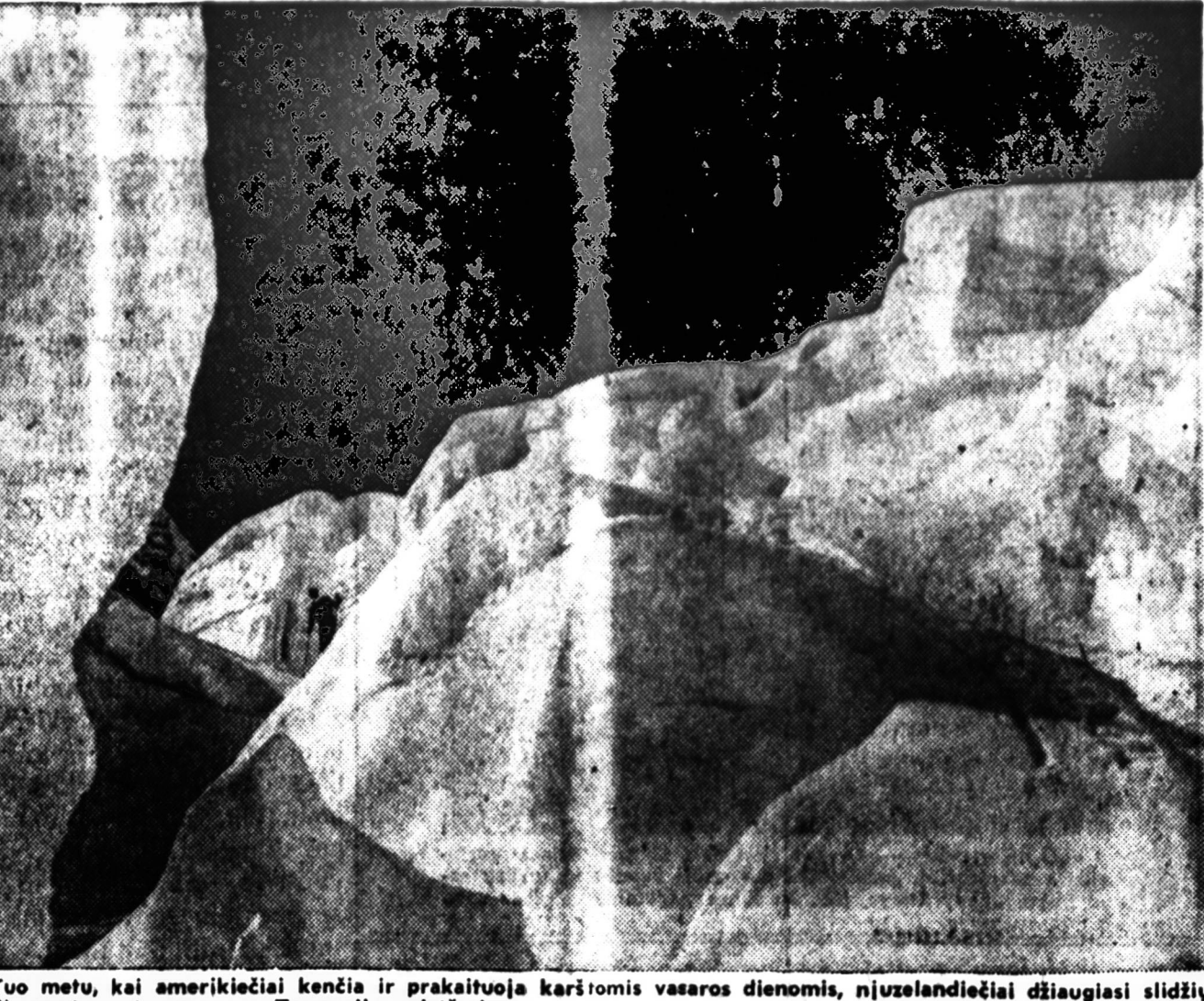
Tuo metu, kai amerikiečiai kenčia ir prakaituoja karštomis vasaros dienomis, nįuzelandiečiai džiaugiasi slidžiū (skl) sportu ant masyvūs Tasmanijos gleitėrio.