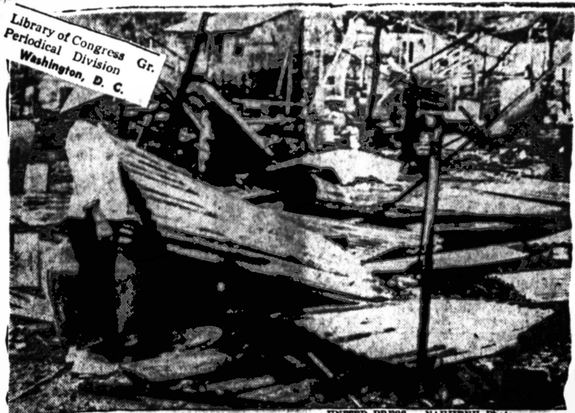
PUOLIMO CENTRAS — Čia matome Čai Be priuėsius po neseniai įvykusio komunistų puolimo Pietų Viet Name. Žuvo ne tik daug vyriausybės kareivių, bet ir moterų bei vaikų. Čai Be yra 50 mylių atstumu į pietvakarius nuo Saigono.

Tai reiškia, jog JAV visiškai nepasitiki komunistų pažadais, nes tie pažadai nuolat yra pažeidžiami arba visiškai nebojami.