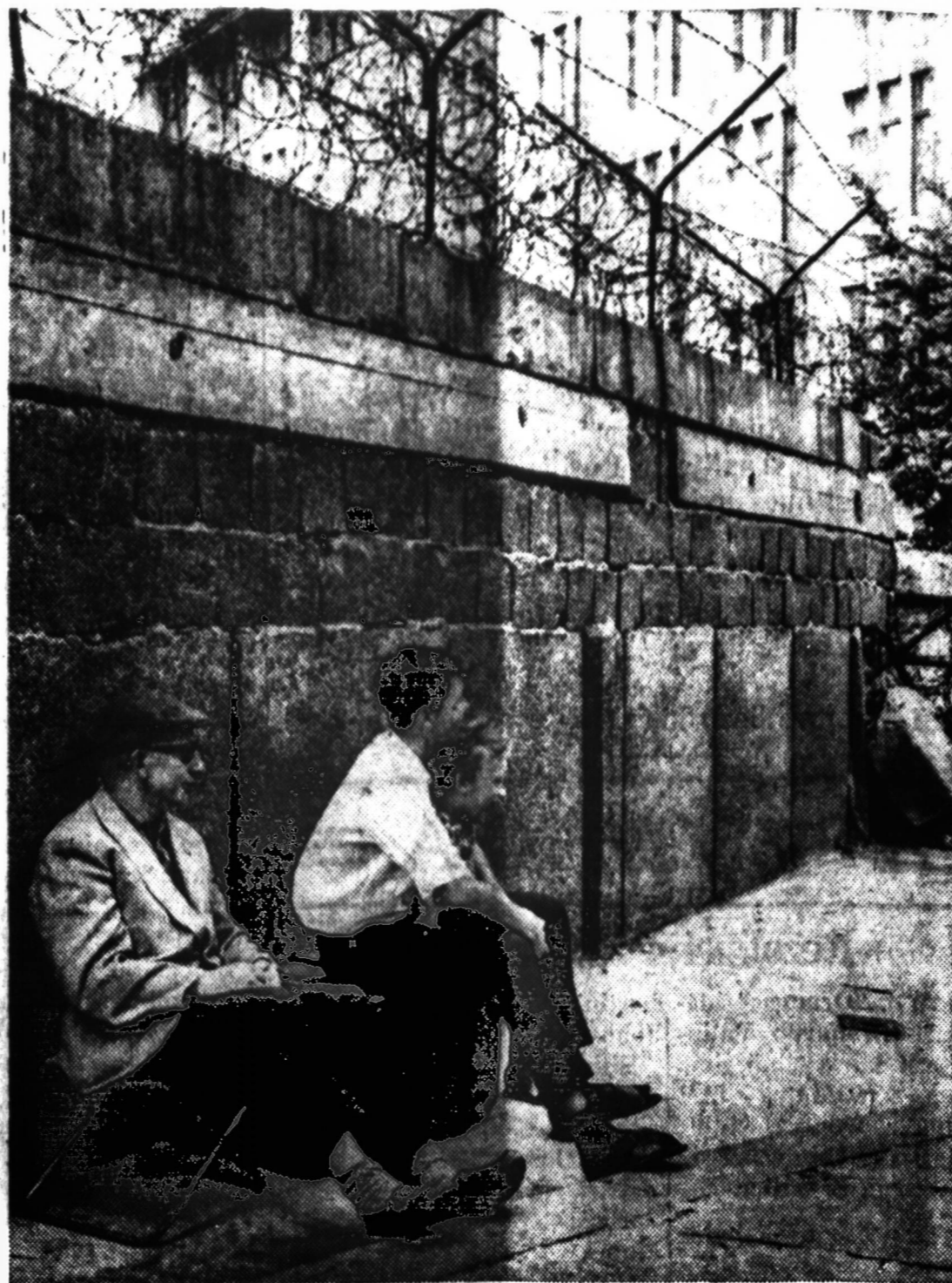
PASAULIO GALE — Vakarų Berlyno gyventojai neapkenčia komunistų pastatytos sienos, skiriančios jų miestą į dvi dalis, bet jie sugalvoja, kokiū būdu galima iš tos sienos vis dėlto turėti šiek tiek tokios naudos: jie sėdi atšalime ir į jos pavėsyje karštomis dienomis.