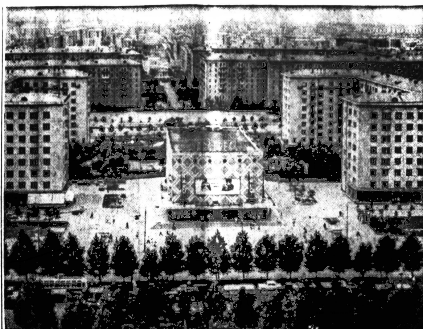
STATYBOS KARŠTIGĖ MASKVOJE — Ši sovietų nuotrauka rodo naujosios Maskvos rajoną su nepabaigiamomis pastatų eilėmis. Vaizdo centre dominuoja puošnus kino - teatras.