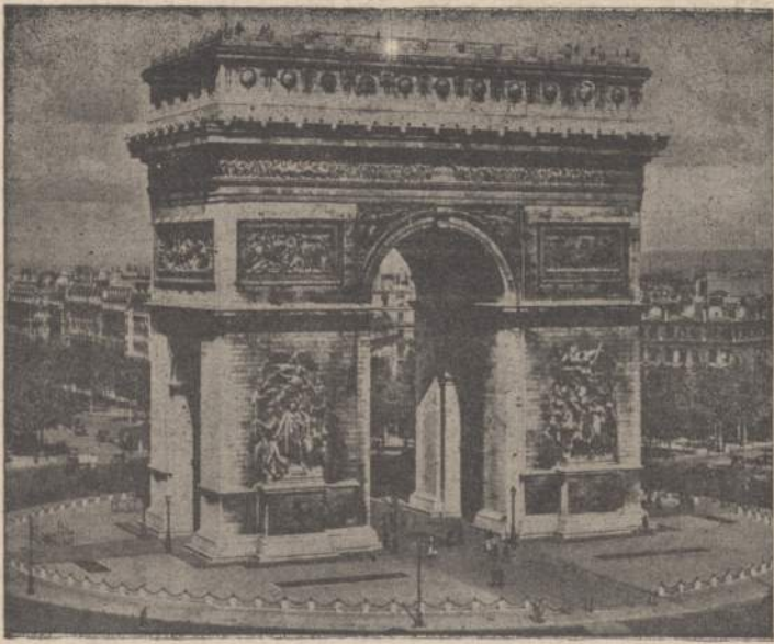
Triumfinė Arka Paryžiuje, mačiusi ne tik gražių laimėjimų, bet ir skaudžių pralaimėjimų.