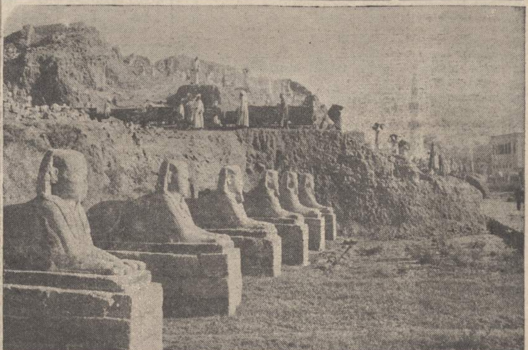
SFINKSŲ GATVĖ — Šitie, neseniai atkasti sfinksai, išliko visai sveiki, nors išbuvo tris tūkstančius metų po 60 pėdų storio smėlio sluoksniu Luksore (Luxor), Egipte. Maždaug 1,400 šitų sfinksų stovi išilgai dviejų mylių kelio.

Jonukas buvo talentingas smuikintas, tik nemokėjo griežti.