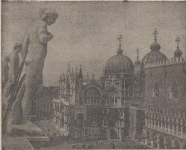
Venecijos kunigaikščių rūmai ir šv. Morkaus bazilikos puošmenos. Kiekviena čia matoma statula yra patyrusio menininko iškalta iš marmoro. Rūmų rūsiuose romėnų laikais buvo laikomi vergai.