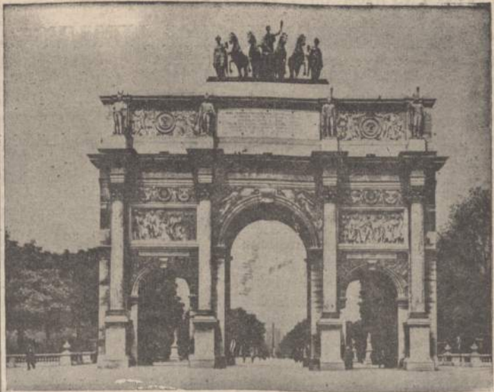
Brandenburgio vartai Berlyne