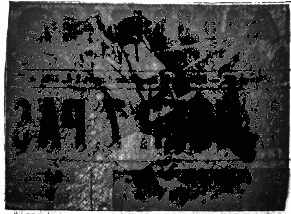
Gelbėjimo būrijo vyrų židini, kaip pavyzdys vertis visą grupę kalvos šlaito, Čempingolės, Prancūzijoje, kur širdies kankiose žemais buvo užverst darbininkai, kurių bent dalį likimai išgelbėti.

Minėtuose straipsniuose yra prirašyta daug neįtikėtinų dalykų. Pavyzdžiui liepos 18 d. straipsny rašoma: "Jeigu nebūtų buvę išeita iš vokiečių globov... tai šiandien gimnazija turėtų patalpas, mokytojams vokiečių didžio algas..." ir t. t. Į tai yra galima tik trumpai pastebėti, jei ši mokykla būtų pasilikusi vien vokiečių materialinėje globoje, tai lietuviškos Vasario 16 gimnazijos, dėl cenzūrotų mokytojų trūkumo ir palygint ma-