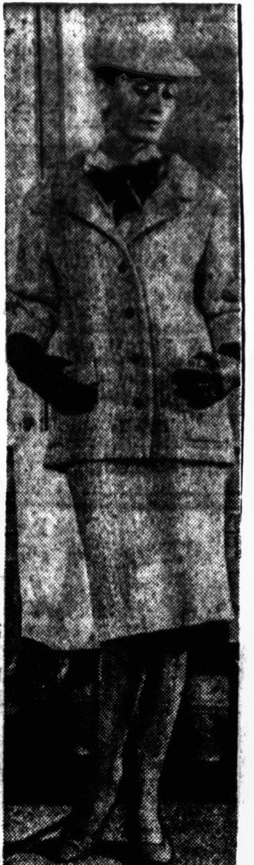
Madų demonstravimas New Yorke primena mums, kad ruduo jau ne labai toli. Beje ir baltos spalvos švarkas derinamas su lengvu sijonėliu.

SIUNTINIAMI I LIETUVĄ IR KITUS KRASTUS 1. Pranešama, kad siunčiami siuntiniai iš Chicago į Lietuvą ir kitus kraštus. Teikiama visas informacija siuntinių reikalu. Čia pat vietoje yra didelis pasirinkimas prekių, turintis geriausią kainą siuntimui.