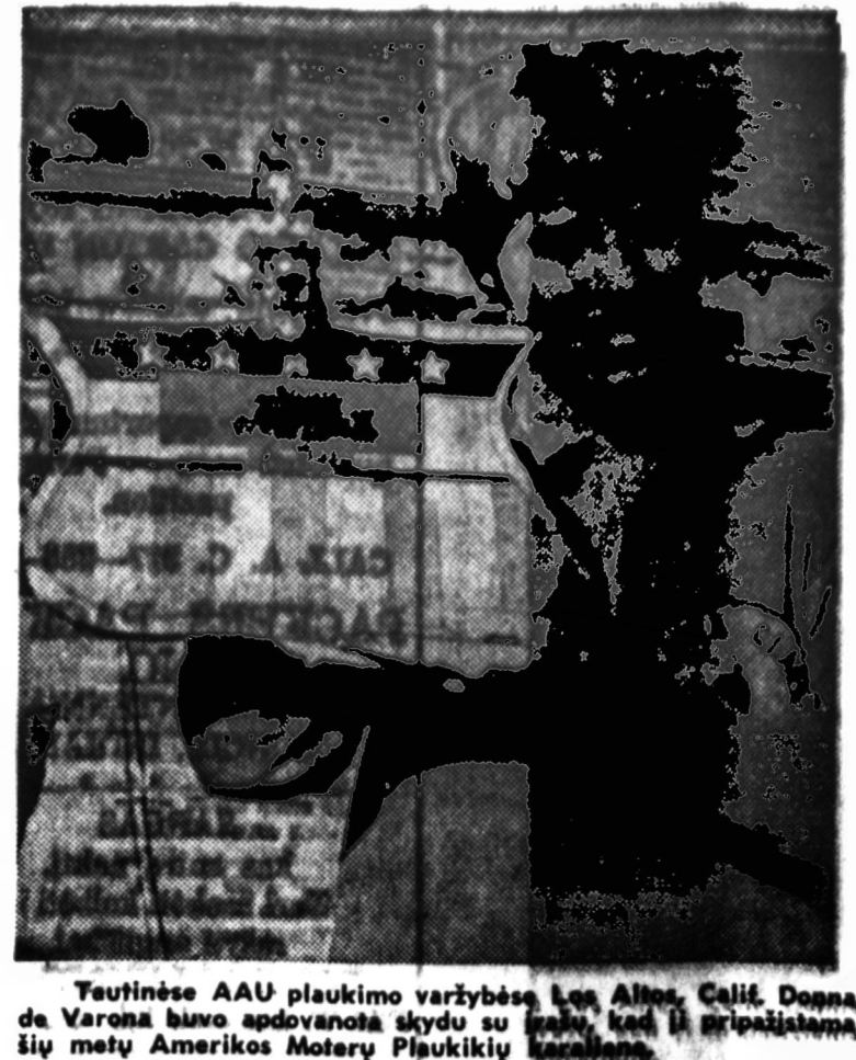
Teutinėse AAU plaukimo varžybėse Len. Alton, Calif. Donna de Varona buvo apdovanota skydu su moterų, turinčių šiuos Amerikos Moterų Plaukikų laureatų.