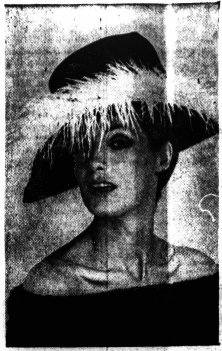
Rudens sezono mady toną sudaro švelnumas. Čia matome skrybėlę plačiomis atbrairomis su lanksčiomis baltomis plunksnomis.

Geriausia siųsti siuntinius į Lietuvą per WORLD PARCEL SERVICE 2715 West 71st Street Chicago, Ill. 60629 Tel. 471-4294 6 — NAUJIENOS, CHICAGO 8, ILL. — THURSDAY, AUGUST 6, 1964