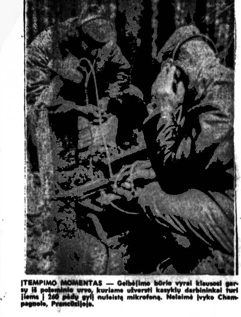
ĮTEMPIMO MOMENTAS — Gelbėjimo būrio vyrai klausosi garso iš požeminio urvo, kuriame užverstai kasykly darbininkai turi joms į 260 pėdų gyly nutiestą mikrofoną. Naisėnai įvyko Champagne, Prancūzijoje.

Help Keep Our Economy Strong BUY U. S. SAVINGS BONDS