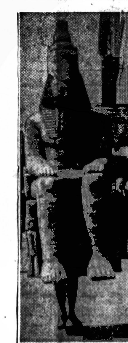
Langvas Abu Simbel paminklų reprodukcijų svoris leidžia jas nešioti po Washingtoną, renkant aukas tikriems paminkliams apsaugoti nuo kylančio vandens prie Asvan užtvankos Egipte.

Leopoldville yra trečias savo didumu Kongo miestas. Prieš to miesto užėmimą per radiją buvo atsišaukta, prašant pagalbos. Kiek žinoma, tame mieste buvo ir keli amerikiečiai. Apie jų likimą nieko nežinoma. Tačiau Amerikos konsulas Michael Hoyt, manoma, spėjo miestą aplėisti prieš jį užėmimą.