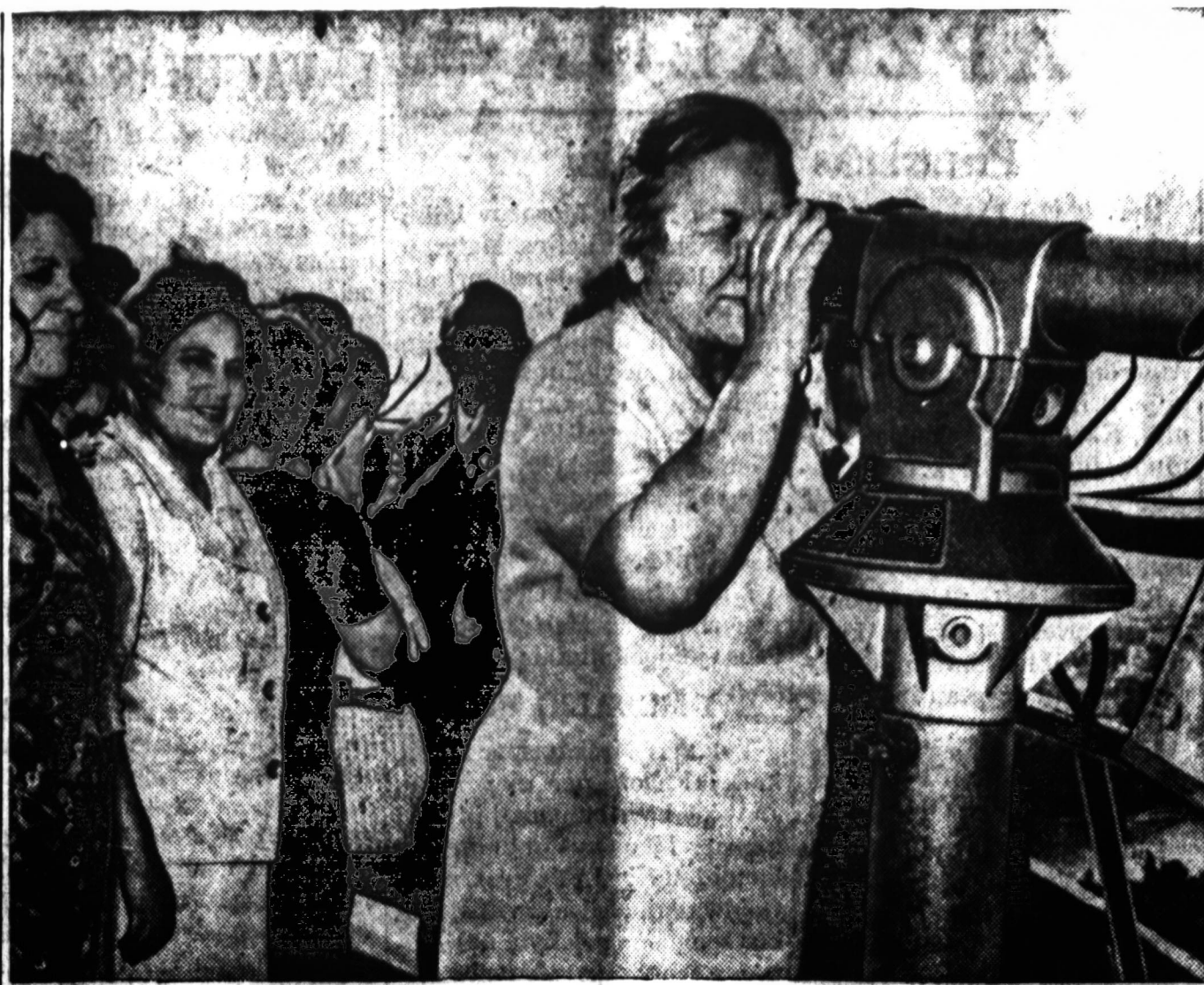
Tuo metu, kaip ponas Chruščiovas posėdžiavo su Gamalu Abdel Nasseriu, jo žmona per teleskopą gėrisi Kaloro, to senoviško miesto, vaizdais.