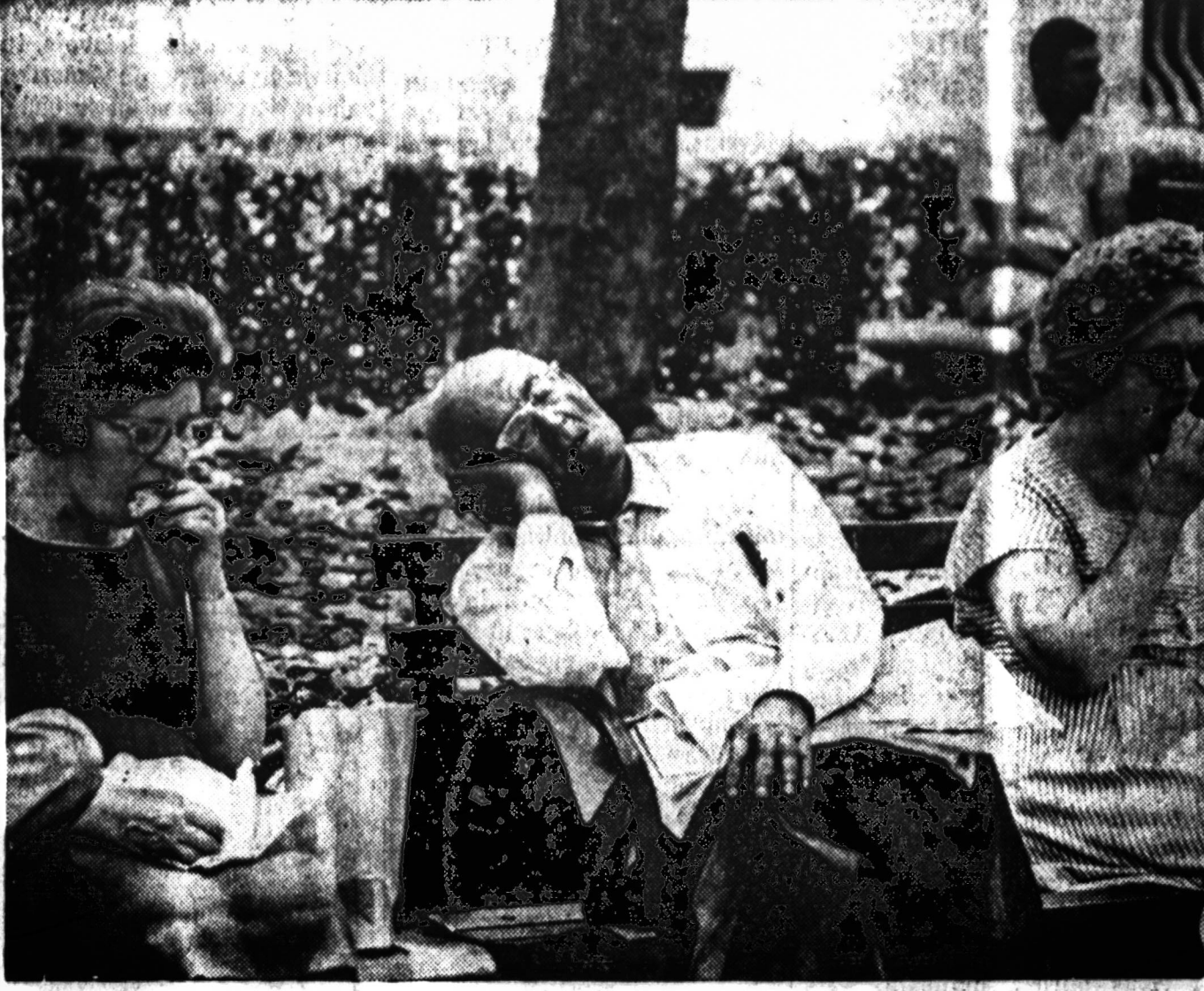
MUZIKINIS SNUSTELĖJIMAS — Pietų metu Bryant Parke, New Yorke, netoli miesto bibliotekos, kasdien transliuojami koncertai, kurių klausydamiesi vieni užmiega, kaip kad žia senukas, kiti — valgo su apetitu, šopeno ritmą skatinamu.

Geriausia siusti siuntinius į Lietuvą per WORLD PARCEL SERVICE 2715 West 71st Street Chicago, Ill., 60629 Tel. 471-1424