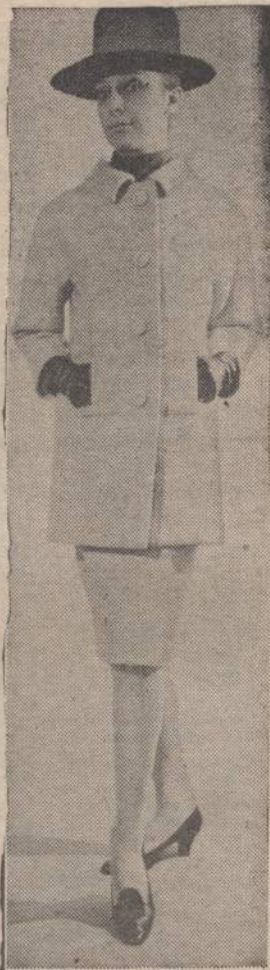
Pasivaikščiavimo gavinančiomis vėsiosiomis dienomis labai tinka šis Parvyžiaus bulvarų mados vilnonis švarkas, siauras sijonėlis ir šan-tungo (Kinijos provincija) šilko bluzė.

Vos apie 11 valandą kitos dienos ryto (1.8) vėl užpildo miestelį pabėgėliai. Diena nepaprastai graži — jokio debesėlio. Saulė kaitina visu vasaros stiprumu. Inžinierius švilpa suorganizuoja ūkininkų grupę apie 50 vežimų ir gauna leidimą pereiti sieną. Įsijungiam į šią grupę ir mes. Apie 12 val. atidaroma siena: vėl oro puolimas. Subėgam į bažnyčią ieškodami apsaugos nuo kulky. Bet šį kartą lėktuvai pasitenkina tik žvalgymu ir vėl išnyksta. Gaunam įsakymą važiuoti per širvintos tiltą skiriančią Lietuvą nuo Rytprusių. Iki šiol vokiečių nepabėgusi administracija įsako imti kiekvienam