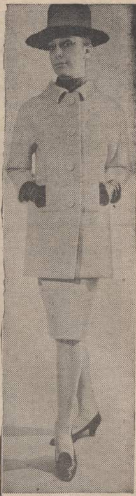
Pasivaikščiavimui gaivinančiomis vėsioomis dienomis labai tinka šis Parvyžiaus bulvarų mados vilnonis švarkas, siauras sijonėlis ir Šan-tungo (Kinijos provincija) šilko bluzė.

Vos apie 11 valandą kitos dienos ryto (1.8) vėl užpildo miestelį pabėgėliai. Diena nepaprastai graži — jokio debesėlio. Saulė kaitina visu vasaros stiprumu. Inžinierius švilpa suorganizuoja ūkininkų grupę apie 50 vežimų ir gauna leidimą pereiti sieną. Įsijungiam į šią grupę ir mes. Apie 12 val. atidaroma siena: vėl oro puolimas. Subėgam į bažnyčią ieškodami apsaugos nuo kulku. Bet šį kartą lėktuvai pasitenkina tik žvalgymu ir vėl išnyksta. Gaunam įsakymą važiuoti per širvintos tiltą skiriamą Lietuvą nuo Rytprūsių. Iki šiol vokiečių nepabėgusi administracija įsako imti kiekvienam