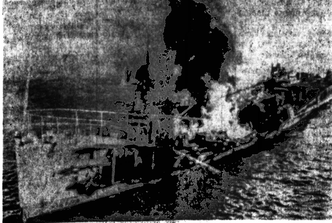
Kipričių žvalgybinis laivas dega, nukentėjęs turkų oro puolimo metu. Graikai teigia, kad puolimo metu žuvo 300 žmonių.

Kitas nacių kolaboratorius, kuris surado prieglobą Ispanijoje, yra Horia Sima, buvęs Rumunijos "geležinės gvardijos" viršininkas. Jis kiekvienais metais dalyvauja ceremonijose, kuriose yra pageriami Rumunijos laisvanoriai, dalyvavę Franco ginkluotose jėgose laike Ispanijos civilinio karo 1936-39 metais.