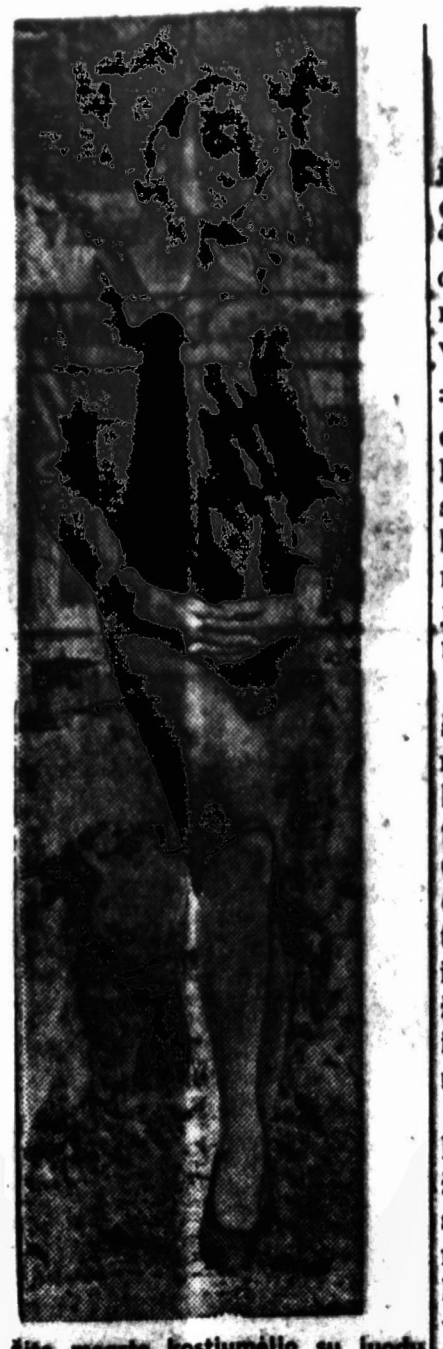
Šito mašos kostiumėlio su juoda faktūrišką projektovežai iš New Yorko patys mašai nuvaliavo ten, kur stovyklavo to kostiumėlio savininkas.

Laukė jau tamsu. Vienas mašinos ūžimas merkia mieguli akis, bet prigimtas smalsumas nelekdžia jį atspauti visai. Matau, kaip skrieja šviesos, kažkur paklymame, kažkur leidžiame... Girdžiu, sako: "Jūs esate tikrajame kely". Praskrieja daug vaivorykių spalvų — tai