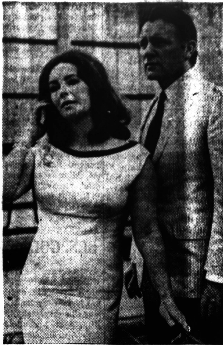
LIZ IR RICH. — Vykdami į Vakarų pakraštį (Elizabeth Taylor ir jos vyras Richard Burton trumpam buvo sustoję Chicagoje. Juodu buvo New York'e iki R. Burton baigė vaidinti "Hamletą".

Netoliausiai nuo čia, šiame pačiame Superior ežere, arčiau