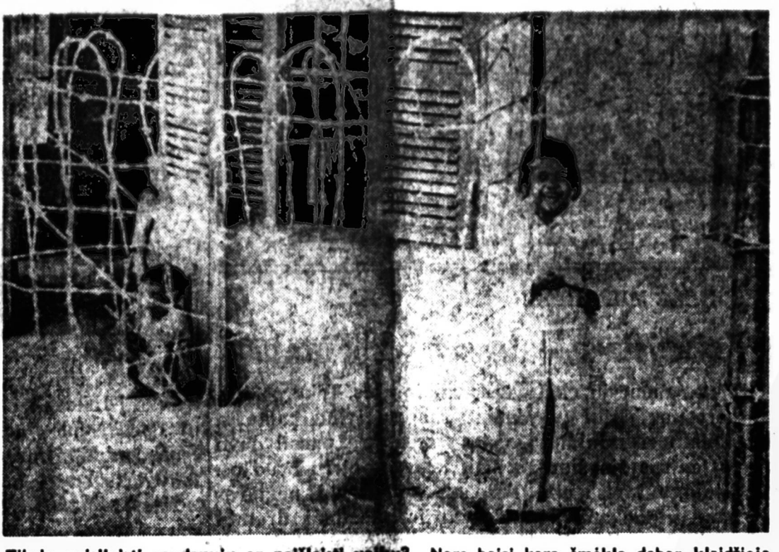
Tikslu neįsileisti raudonųjų ar neteisių valstybių? Nors baisi karo šmėkla dabar klaidžioja Pietų Viet Name, bet šitie vaikai už spygliuotų vielų tvoros, kuria aptvertas jų namas, lysspai fotografuojami. Spygliuota tvora, tur būt, neišgins raudonųjų, bet ji neileidžia vaikams nutolti nuo namų.

ELKO, Nev. — Sekmadienį kilo dideli gaisrai Nevados miškuose. Liepanos apėmė apie 40-400 akrų miškų, gulinčių į šiaurę nuo Elko. Manoma, kad gaisrus sukėlė perkūnija, kuri pradėjo siausti šioje apylinkėje. Gaisrai padarys labai didelius nuostolius vietos girioms. 800 gaisrų gesintojų dirba keliose vietose, bandydami sustabdyti liepsnų plitimą. Lėktuvai purškia chemikalus į specialiai parinktas vietas, kad gaisrai nepilstų. Miškuose yra daug išdžiuvusių šolės, kuri dega kaip parakas. Iki šio meto gaisrai dar ne-