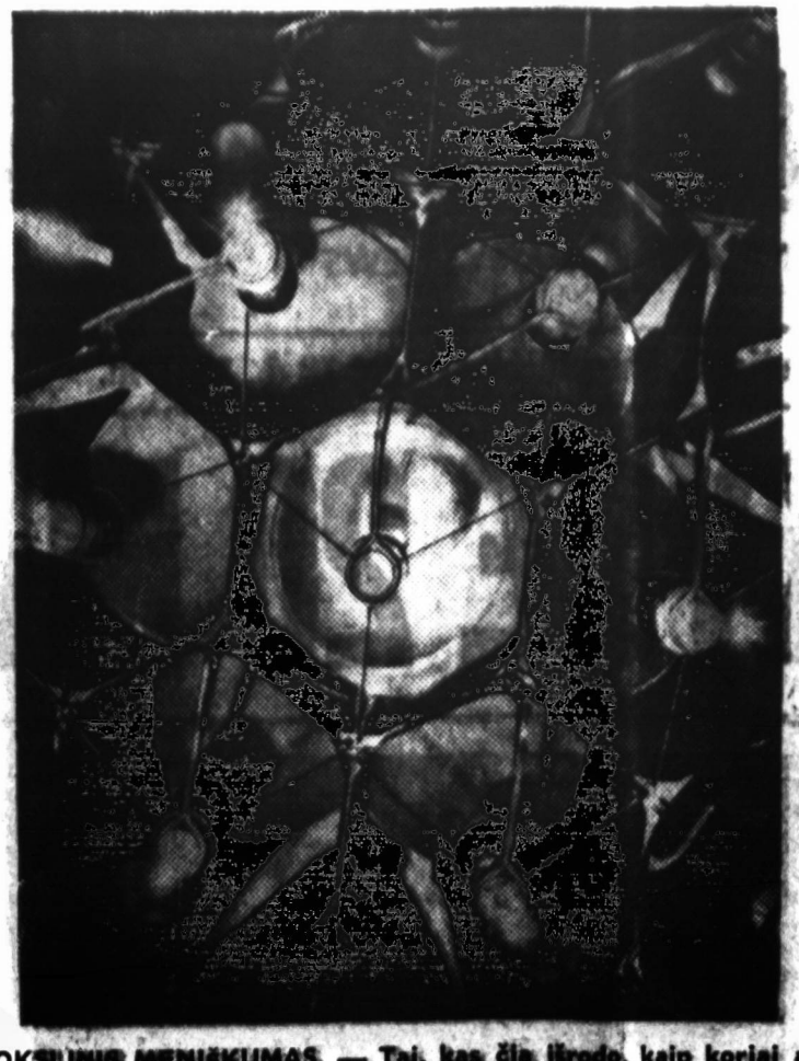
MOKSLINIS MĖNESIŠKUMAS. — Tai, kas šiuo metu, kaip kometai aulėje, iš tikrųjų yra optiniai prietaisai, kurie išbandomi satelitais NASA centre, Marylande.