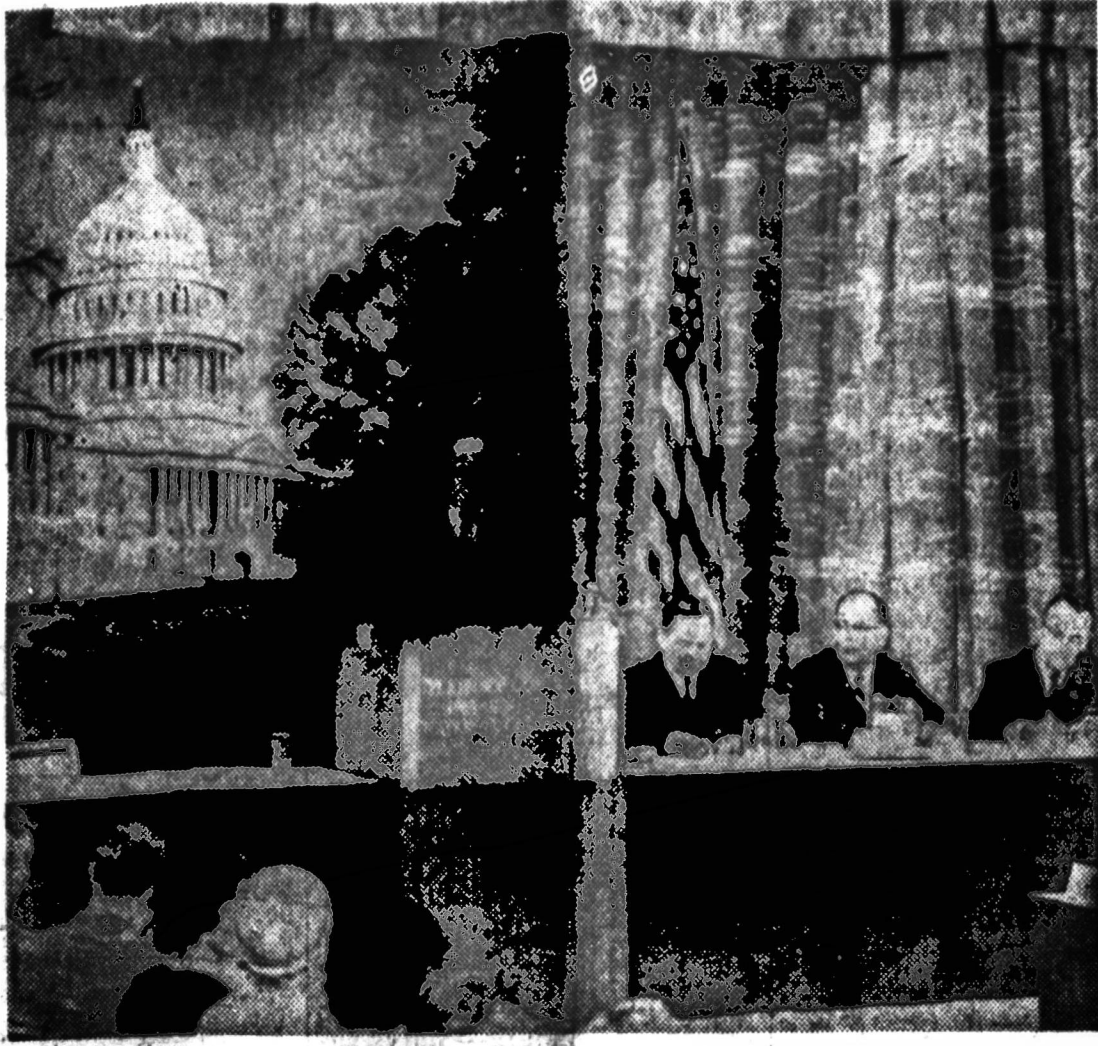
NUKLAMA BENDRA PLATFORMA. — Čia vienas iš vaidų Sheraton Parko hotelyje, Washington, iš Demokratų Platformos Komiteto posėdyje. Tribūnoje Valstybės Sekretorius Dean Rusk.

Manoma, kad Europoje atsiradęs lūkesčių, kuris praeito karo metu valdė panašius lūkesčius.