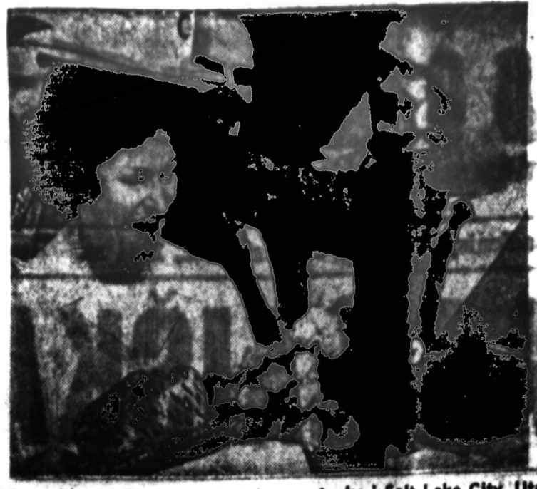
Kai prezidento žmona, ponė Johnson atvyko į Salt Lake City, Utah, senąjį Frank E. Moss užėjo į ai ant galvos LBJ skrybėlę.

"Prieš dvi savaites atvykusios, kūrėmės Romuvos stovykloje. Kilo palapinės viena po kitos, kol užaugo visas miestas. Kur