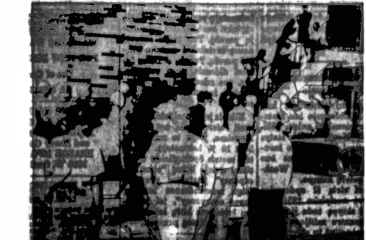
ATVIRINMAS "DIXMOORE". — Eliautas Dixmoore, Ill., pristatė Lietuvos knygų parodą, kurioje dalyvavo daugelis Lietuvos emigrantų. Paroda vyko "Dixmoore" mokykloje, kurioje dalyvavo daugelis Lietuvos emigrantų. Paroda vyko "Dixmoore" mokykloje, kurioje dalyvavo daugelis Lietuvos emigrantų.

SKALINK IR KIDAM PABARA BENTYMI NAUJAVIMAI