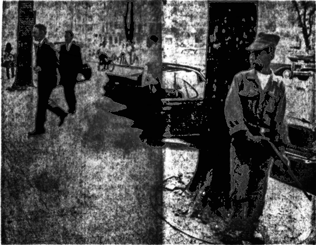
SAIGONO GATVIŲ VAIZDAS. — Dėl partizanų ir pagrindinio komunistų veiklos gyvenimas Pietų Viet Name pasidarė pavojingas. Kasdieninį gyvenimą varžo griežtos taisyklės. Čia matome JAV ambasadorių, gen. Maxwell D. Taylor, einantį į JAV Informacijos įstaigą Saigone, o prie jo — ginkluotą sargybini.

kurios nevarginą ekonomis atoslūgis ar depresija. Per ketverius metus, apskaičiuojant pinigais, produkcija pakilo 150 milijonų dolerių. Ties jį nepakilo per visus aštuonis Eisenhowerio administracijos metus.