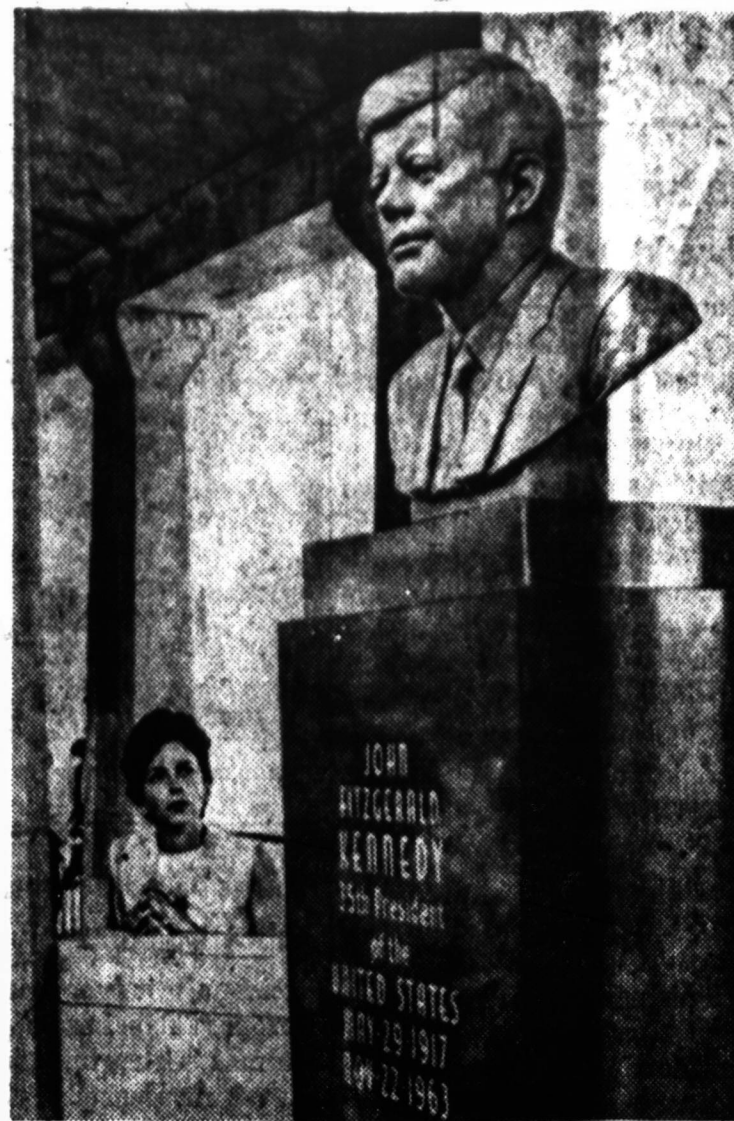
Paminklas 35-tam JAV prezidentui John F. Kennedy. Šis paminklas pastatytas Atlantiškos JAV Demokratų konvencijos suvažiavusieji delegatai turės progos pamatyti. Jį paminklą ir pagerbti žuvusį prezidentą.