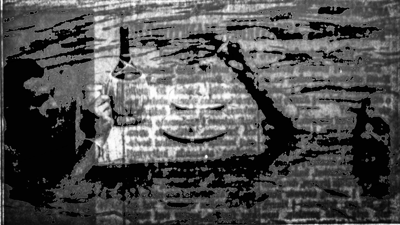
Šiame vaizdiniame moteris apipietauti Tėbes, mągalinami pabūti karščių. Vynas ir makaronai buvo nebūti, bet, poldory padėtas kiek vandeninias.

Tuo būdu, vietėje "blitzkriego", karas išsivystė į kovą ap-