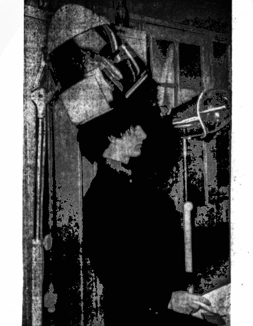
Deugelis nežino, kodėl iš Anglijos atstaveusvy dainininkų beates plaukai taip kaitali atrodo. Vieni vartoja perukus, bet visi var-toja moteriškus plaukams džiiovinti prietaisus. Čia matome Ringo Starr, sėdinčį motery plaukų prietaisy.

NAUJIENOSE GALI RAŠYTI KIEKVIENAS IR APIE VISKĄ