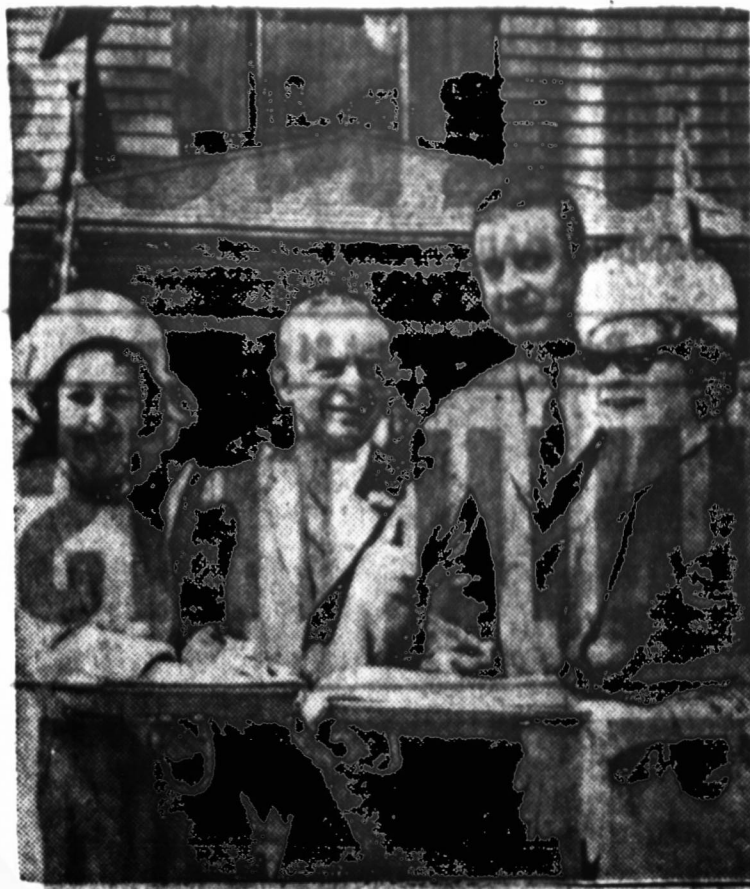
Comorbello saloje Kanados premjero žmona (dešinėje) ir JAV prezidento Lyndon Johnson žmona (dešinėje) atėjo gultis suoseviškai International Memorial Park. Sveikintis moteris (stovinti) pasitinka autorius, pasitinkantis svečių grupę.

— Kitą dieną jau mums buvo paruoštas planas svarbesnes Vilniaus vietas pamatyti. Eijome, važiuavome ir vaikščiojome, bet buvome gerokai išvargę. Nukamuoja ir vaikščiojimas. Atėjo metas ir giminėms namo išvažiuoti... Man buvo įdomu pasivaikščioti po Vilnių ir pamatyti naujai statomus namus, bet man labiausiai rūpėjo pamatyti gimtinį mūsų kaimą. Kaip žmonai, taip ir man rūpėjo pamatyti, kaip tie mūsų broliai ir seserys gyvena. Aš pristatytam palydovui pasakiau, kad norin išvažiuoti į kaimą. Pasirodo, kad jis jau