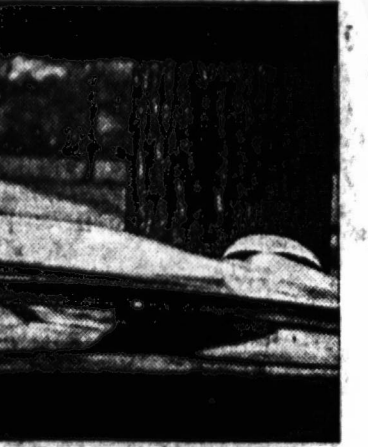
He wore his seat belt