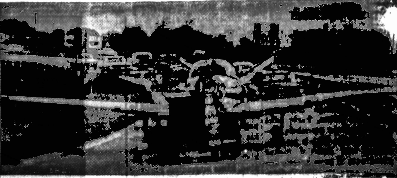
Gana dažnai plačiuose Amerikos plentuose lėktuvai sustabdo trafiką. Nėlaimės metu lėktuvai sustabdo greitai plyną, bet kai lėktuvas nuo kelio nuvilkamas, tai automobilių trafiką sustabdo. Pavėluota gatvė ant 74 kelio, ties Brownsburg, Ind., nusileidusi ir vėl eina lėčiau.

Bendra darbavijų nuomonė, ne tiek svarbu, kiek darbininkas uždirba, bet su kiek jis išsiverčia, Lenkijai mažai taikintina, nes dėl aukštų gyvenimo išlaidų taupymui mažai kas lieka. Pagal oficialius duomenis du trečdaliai visų dirbančiųjų uždirba žemiau dviejų tūkstančių. Sekantieji ketiną pavyzdžiai turėtų išsilygti vidutiniškai darbui per mėnesį gali: už kilogramą kvadratinės duonos penki zlotai, už kilogramą (2 sv.) jautienos (be kaulų) 36, už viršų kumpį, be sviesto, 70 zlotų kilogramui. Aviečių kiaušinių vienetas 218 zlotų, tiliškės riebus sūris 42, bulvės 172 ir kava 250 zlotų už kilogramą. Litras vandkos, 40 laipsnių, 97 zlotai. Kamgarnu medžiaga šimto nuosimėjų vilnų (metras): 530, pora vyrų rūbų pusačių: 330, popelės tokių pajamų poziciją, kuria iš viso naudojami 6,370,000 krašto piliečių, vakarais valo raištinės patalpas. Be to, du iš keturių kambarys, kuriuos užėmė 4 jų šeimos nariai, yra išnuomoti. Visa tai kartu per mėnesį sudaro 5,000 zlotų, o tai