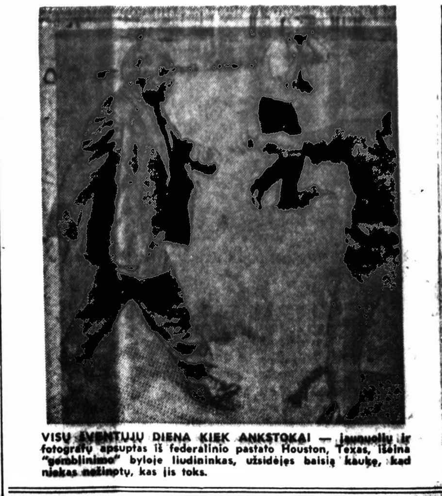
VISU SVENKTUJU DIENA KIEK ANKSTOKAI - jaunuolių ir fotografų apsuptas iš federalinio pastato Houston, Texas, šilėna "parablinimo" byloje liudininkas, užsidėjęs boston, kas, kad niekas nežino, kas jis toks.

O pagal Teofilį Tilvytį, kai mes šiandien kalbame apie Donelaitį, turime galvoje visus dorus žmones... kovojančius už taiką. Tad, teigė Tilvytis, Donelaičio vardas ir Lemontovo, Šekspyro ir Mykolo Angelo vardų. (E)