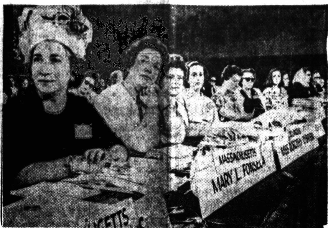
Atlantic City, N. J. mieste posėdžiauja demokratų partijos platformos komitetas. Paveiksle matome kelias moteris, minėto komiteto nareis, klausiančias liudininkų daromus pareiškimus.

MADRIDAS, Ispanija. — Buvęs Argentinos diktatorius Juan D. Peronas yra įsitikinęs, kad jis dar šiais metais galės grįžti į Argentiną. Jis gana plačiai kalbėjęs su atvažiavusiais Argentinai politikais. Jis esąs įsitikinęs, kad dabartinė būklė ilgainalgi negalės tęstis. 1955 metais Argentinos karalius išvyko Peroną. "Daugelis galvų risis, kai aš sugrįšiu", — tada pareiškė Peronas. Dabar jis nekalba apie keršą, bet jam atrodo, kad jis galės sugrįžti suvienyti krašto gyventojus ir siekti ekonominės gerovės. Jeigu buvęs diktatorius sugrįžtų, tai pirmiausia jam tektų stoti į teismą ir aiškintis, kur dingo Argentinos aukso atsargos.