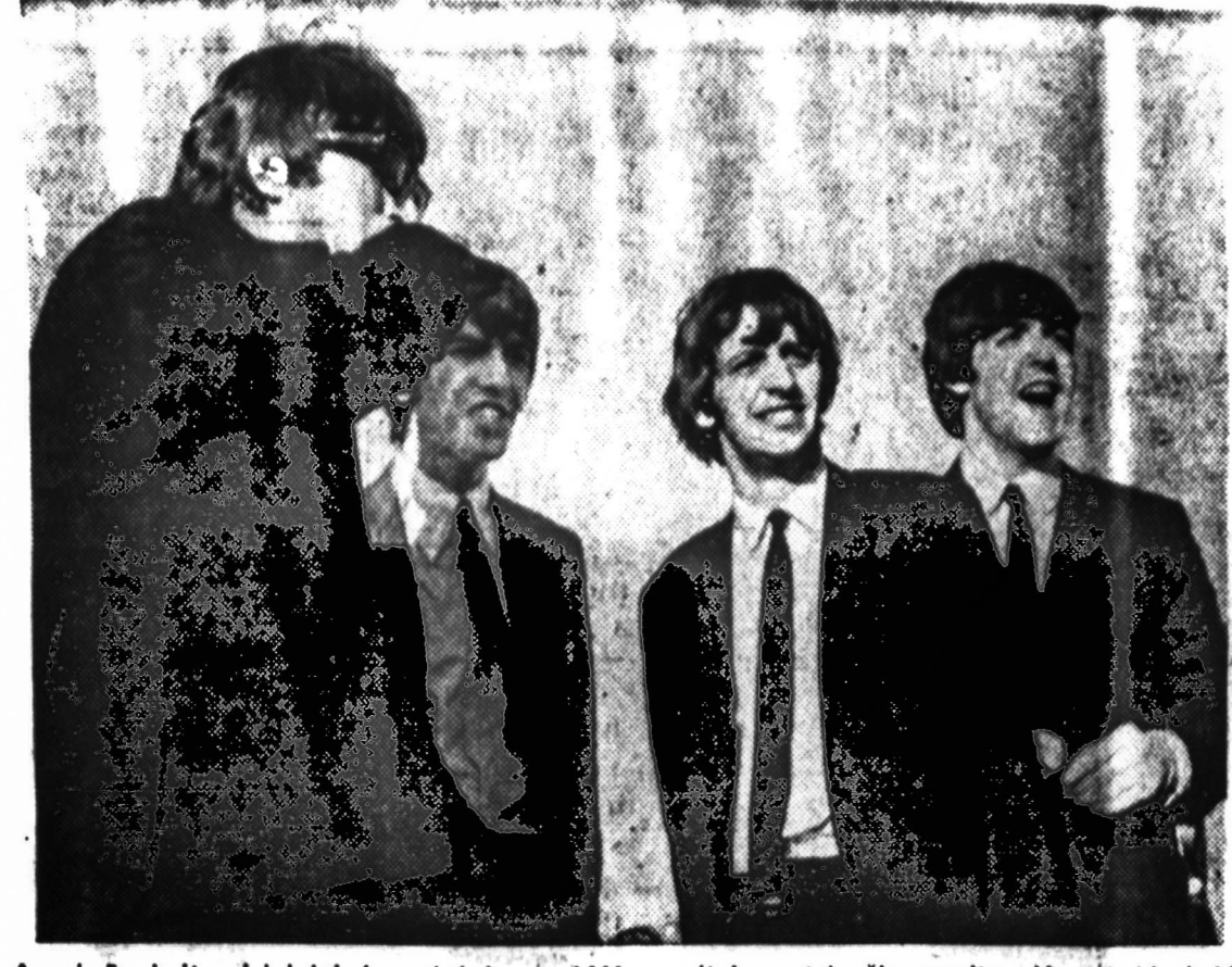
Apsukrūs britų dainininkai, pasipinigavę JAV praeitais metais, iš savaitį vėl atsikrdo į JAV sentimentalų dainų dainuoti. Mokyklinie amžius mergaitės šie dainininkai labai patinka, nes dainuoja joms suprantama kalba ir apie nesuprantamus dalykus.

Toronto Lietuvių Choro "VARPAS" plokščias stereo — $6,00, HI-FI — $5,00. Rašomos mašinos su lietuvių ir kitų kalbų rašdynais. Kaina nuo $30,00. Šias prekes galima siųsti ir į Lietuvą. Visais skaitmeniniais reikalais krepšis į J. KARVELIO PREKYBOS NAMUS 2715 West 71st Street Chicago, Illinois Tel. 471-1424