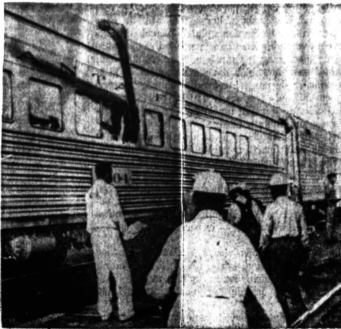
Iš pravažiuojančio prekinio traukinio nuskubo geležinis vamzdis ir įsmigo į pravažiuojantį keleivinį Santa Fe Super Chief vagoną. Šio nelaimingo atsitikimo metu buvo užmušti du keleiviai ir sunkiai sužeisti kiti dešimt. Sužeistieji paskubomis nugubeni į Kingman, Arizona, ligoninę. Paveiktose matome į keleivinį vagoną įsmigusį vamzdis.

vo artimųjų meilei ir pagarbai priminti tiems, kurie pasiliko toli už jūrių marių, už vandenelių — už didžiojo Atlanto vandenyno, kur akys nematė, rankos nepasiekė ir tik širdys atjautė.