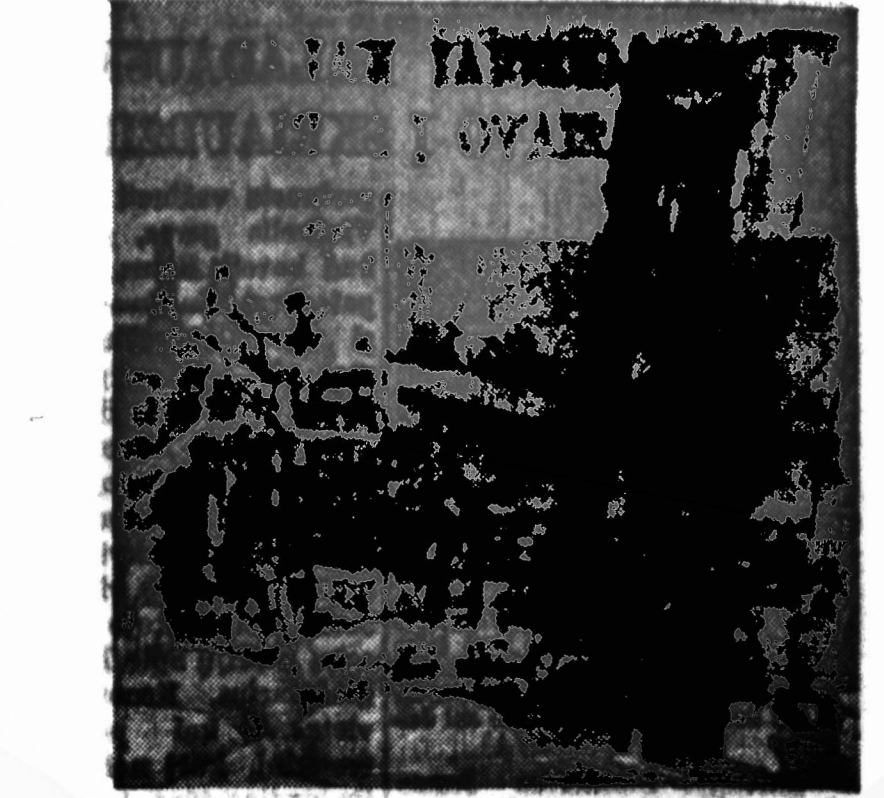
Nevadoje išdėgė dideli mūšai. Pasaulyje žinomas lietuvių giesmių, kėlaunėlių, dainų ir šokių. "Dorokas" parapijonus "sustabdyti" giesmę.

Naujas parapijonus pirmą kartą atvykę į sekmadienio pamaldas ir netekę kantrybės dėl per daug ilgų pamokėsi, pasakė domis klausia šaltmais klaidę