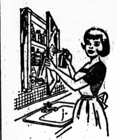
Savo naminių vaistų spintoje rėtikis nepaprastai svarbi ir tvarkingai užlaikyti, kaip žino vaistųdele paruošė: šimti visos būtosios ir išimtosios lėštosios patikrinti visus vaistus, kad netvarkytų klaidų, nes vaistų suvartojimas gali būti fatališkas. Patikrinti, kokių vaistų trūksta ir juos papildyti kad būtų bet kokiam netikėtumui pasiruošę.