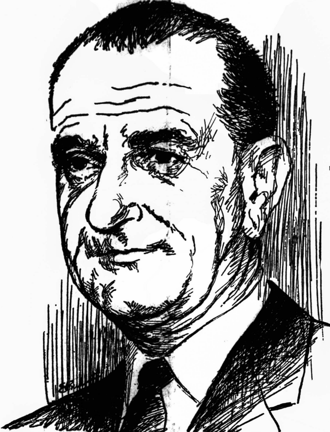
Prez. Lyndon B. Johnson

Mafesniu mastu šimtai norvegų irgi buvo suruošę savo šokių ir dainų programą, kaip norvegų tautinės šventės dalį.