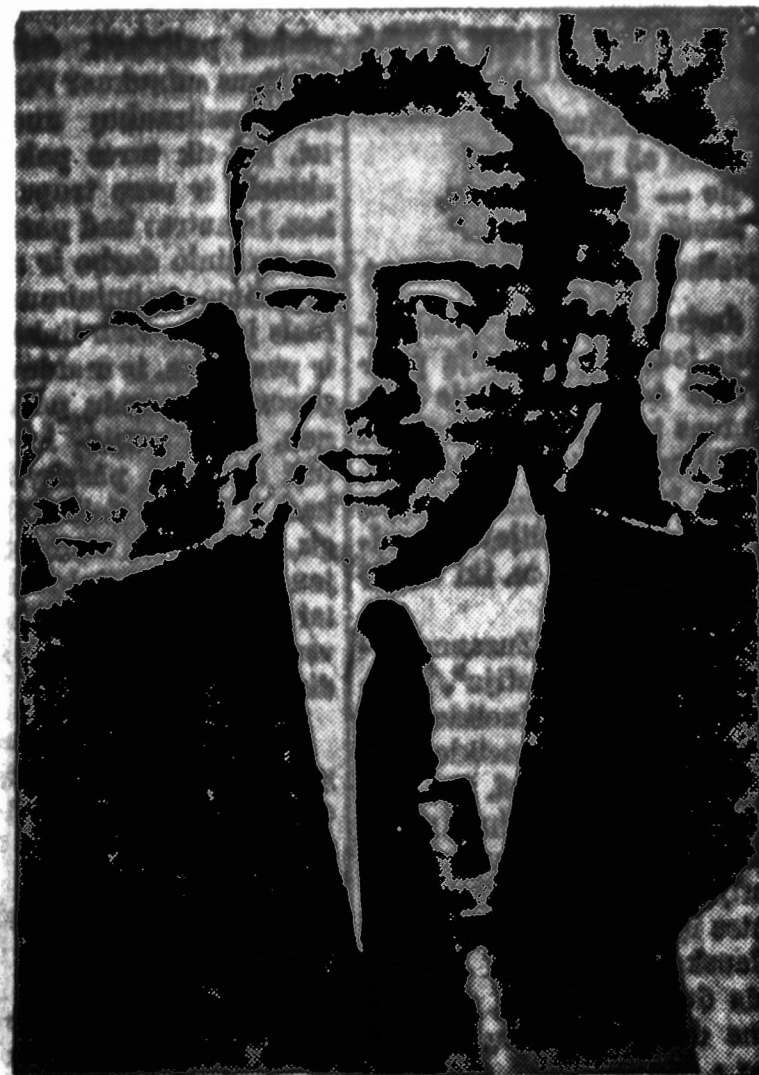
Kupinas vilis. — Eugene McCarthy, Minnesotos senatorius, dažnai minimas, kaip demokratinis kandidatas viceprezidento pareigoms, laukiant konvencijoje.

Tikra tautos nepriklausomybė turi būti pagrįsta tautinio apsisprendimo principu. Kuris šitą principą at-