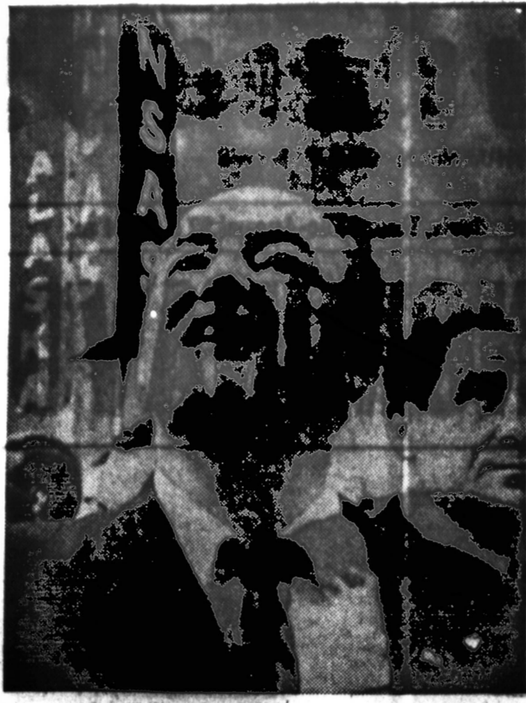
Senatorius Herbert Humphrey iš Minnesotos laukdamas prezidento konvencijoje, ar jis kandidatuos viceprezidento pareigoms ar ne, šis rodo netikėtai laisbala motinai, pasirašytą pakelė šilė.

Ant tokio paties pirmykštės solidžios putos dangčio gyvena-me ir pagyvenę pasilaidojame vi-same žemės kamuolyje, bet ki-priose kontinentuose ta žemės pluta yra per amžius apsinėsu-si dašnai mylių storumo organinė-mis ir neorganinėmis geologini-