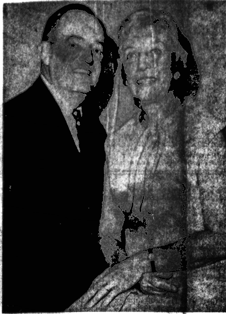
Senatorius Hubert Humphrey ir ponis kartu pasuoja fotografui Atlantic city hotelyje, kuriame jie apsiėmė.

• Airijos prezidentas de Valera dar negali imti maisto arba skyrybių, bet praeitą naktį jis praleido ramiai. Manoma, kad jis atsisveikins su sunkios vidurių operacijos.