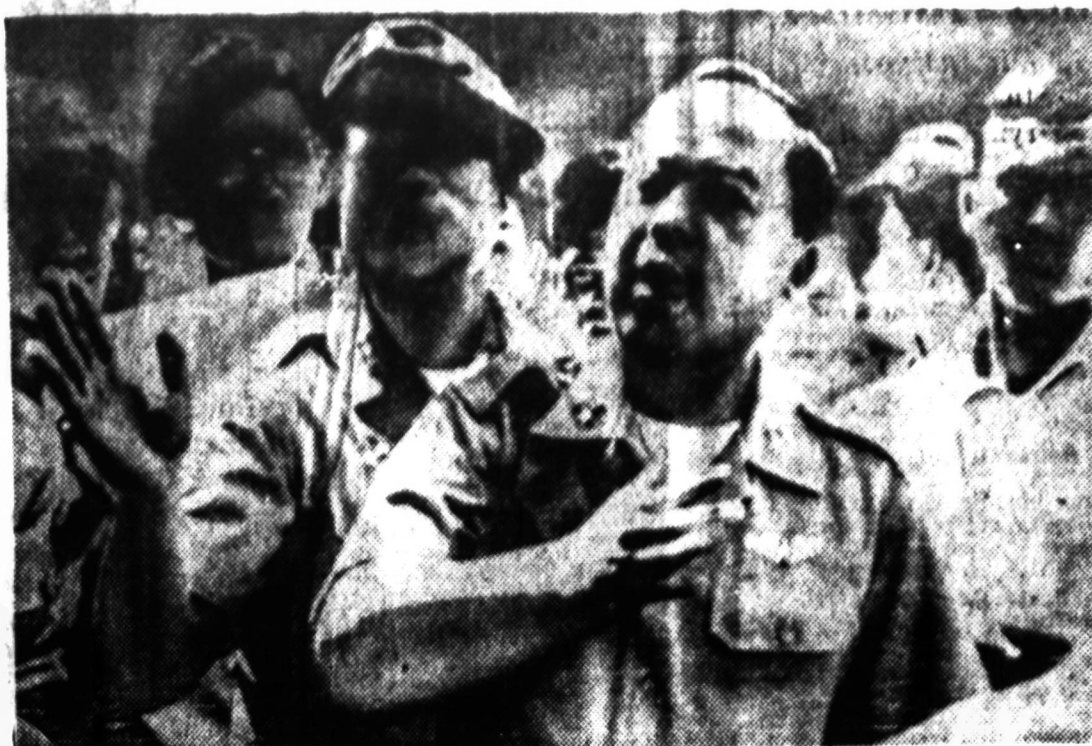
Pietų Vjet Nam vadas pasitraukė iš pareigų — Generalas Ngu yen Khanh vargais negalais stumiamis per Saigono demonstruojančių studentų minią. Pažadai įvykdyti reformas, jei jam bus skirta šiek tiek laiko, nepadejo, ir prezidentas buvo priverstas pasitraukti.

"NAUJIENAS" SKAITO VISŲ SROVŲ ŽMONĖS: DARBININKAI, BIZNIERIAI, PROFESIONALAI, DVASININKAI, VALSTYBININKAI, MOKSLININKAI, JIE ŽINO, KAD "NAUJIENOS" PADUODA TEISINGIAUSIAS ZINIAS IR GERIAUSIUS RASTUS