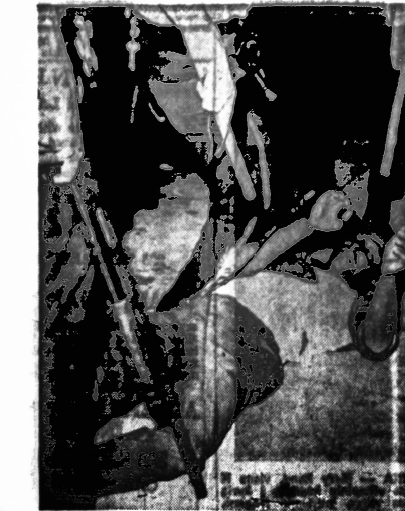
Policija trando jaunuolius trečios riaušių nakties metu Patersono, N. J.