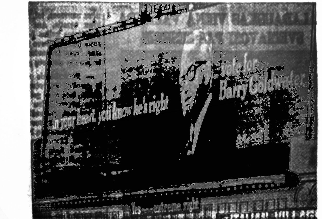
Partiškai šalis. — Įrašų iš paviljono didžioje plokštumoje (netoli konvencijos salės Atlantic City), respublikonai iš pradžių juokėsi. Bet kai vienas grafičią dieną prašvito, jie pamatė komertara, pridėję apatleje.

Vakar, beje, prezidentui Lyndon B. Johnsonui sukako 56 metai amžiaus.