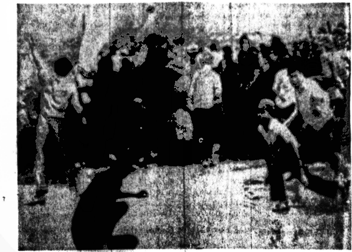
RIAUSĖS SAIGONE. — Demonstrantai, apsaudomi iš vyriausios kariuomenės būstinės, spiečiasi prie spygliuotų vielių barikados. Šaudymas prasidėjo, kai sugūžėjo 3,000 žmonių, reikalaudami grąžinti galį generolui Nguyen Khanh.

POINT ARGUELLO, Calif. — Antradienį paleistas į erdves naujas satelitas Explorer 20, kuris turės padėti išaiškinti, kas yra jonosferoje, kas trukdo radijo transliacijai. Ionosfera yra dar neištirtas elektrizuotas oro sluoksnis tarp 50 ir 200, net 300 mylių aukščiau žemės. Spėjama, kad saulės dėmės jonosferoje išaukia tuštumas, per kuriuos radijo bangos, negaudamos atsitraukimo, išleikia į erdves ir tarsi išaukia tuos trumpus radijo sukrėtimus.