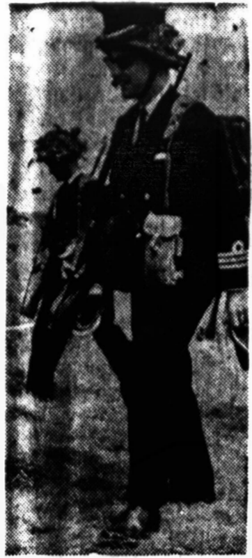
Britų jūrininkas neturėjo kur padėti savo lengvosios kepurės, o mesti jos nenorėjo. Užsidėjo jis ant savo šalmo ir ištekio būdu dalyvavo manevruose. Nežinia, ar vyresnieji jo už tai neapibars.

Ledyno dangai atsitraukus, sakoma ty tyrinėtojų pranešime, žemės pluta atsipalaidavusi nuo neapsakomo spaudimo, vėl iškilė dažnai vertikalinėmis (statmenimis) linijomis. Apie 10,500 metus ledynai (gletčeriai) atsitraukė į šiaurę nuo Superior ežero ir tuomet pasirodė pirmoji sausa žemė šiaurinėje Dakotoje ir Minnesotoje, ką parodo jau tuo periodu ten augę samanės ir medeliai. Pagaliau ledynas pasitraukė į Superior ežero rytinį galą, užtvendamas vandeniu nutekėjimą į rytus, ir rezultate ežeras tarp 10,000—9,000 metų vėl išsiliejo į pietus, bet vanduo jau nebeįstengė vėl išnešti Minnesotos slėnio dugno ir Agasizo ežero vandens paviršius ilgesniam laikui vėl pasidarė pastovus, sunėdamas didelius paplūdimius, žinomus kaip "Campbell Strand-