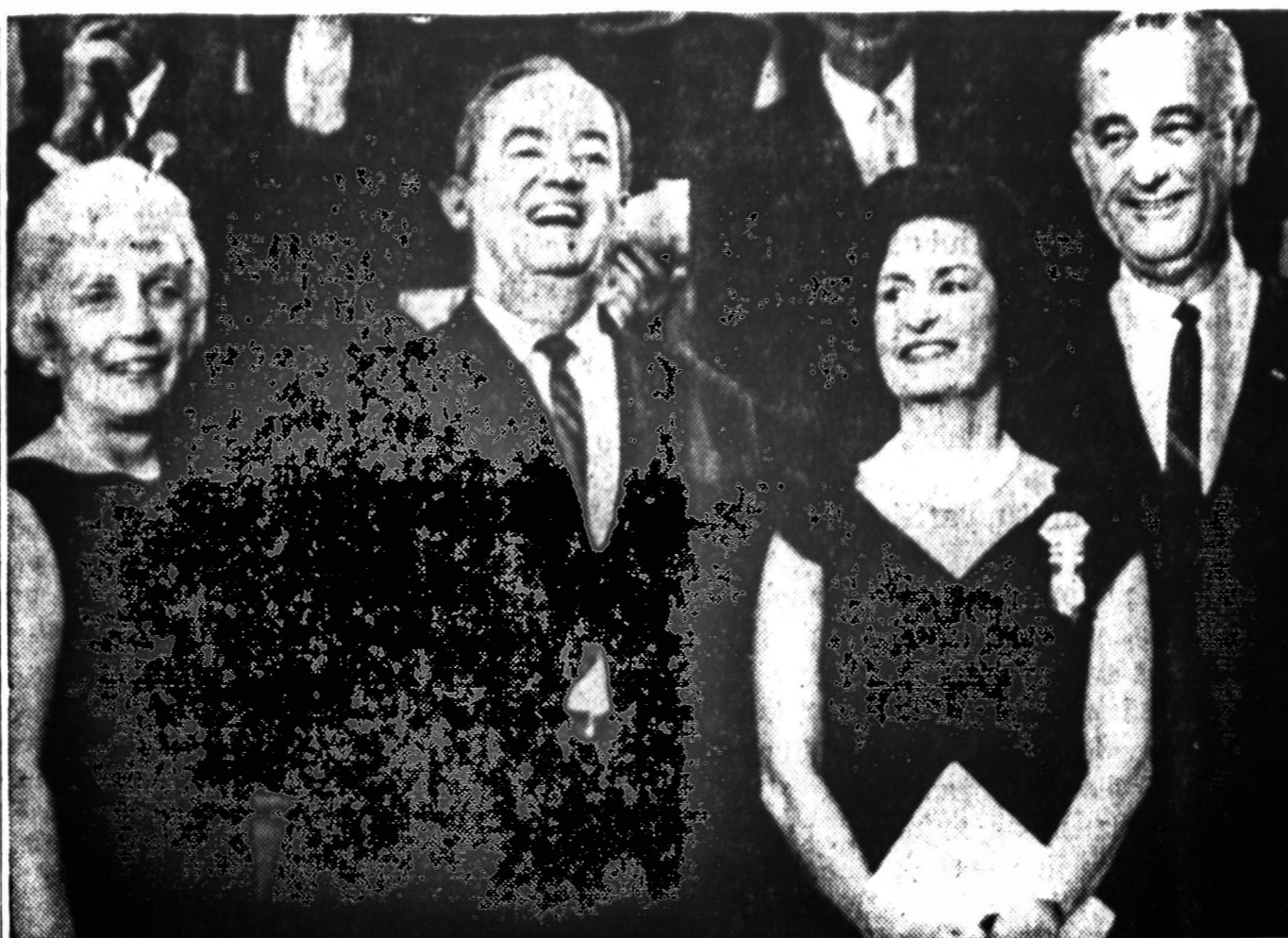
DEMOKRATŲ PARINKTI. — Kandidatai prezidento ir viceprezidento pareigoms su žmonomis pozuoja fotografui prieš prasidedant Demokratų Nacionalinei Konvencijai. Prezidentas Lyndon Johnson su žmona dešinėje, senatorius Hubert Humphrey su žmona — kairėje.