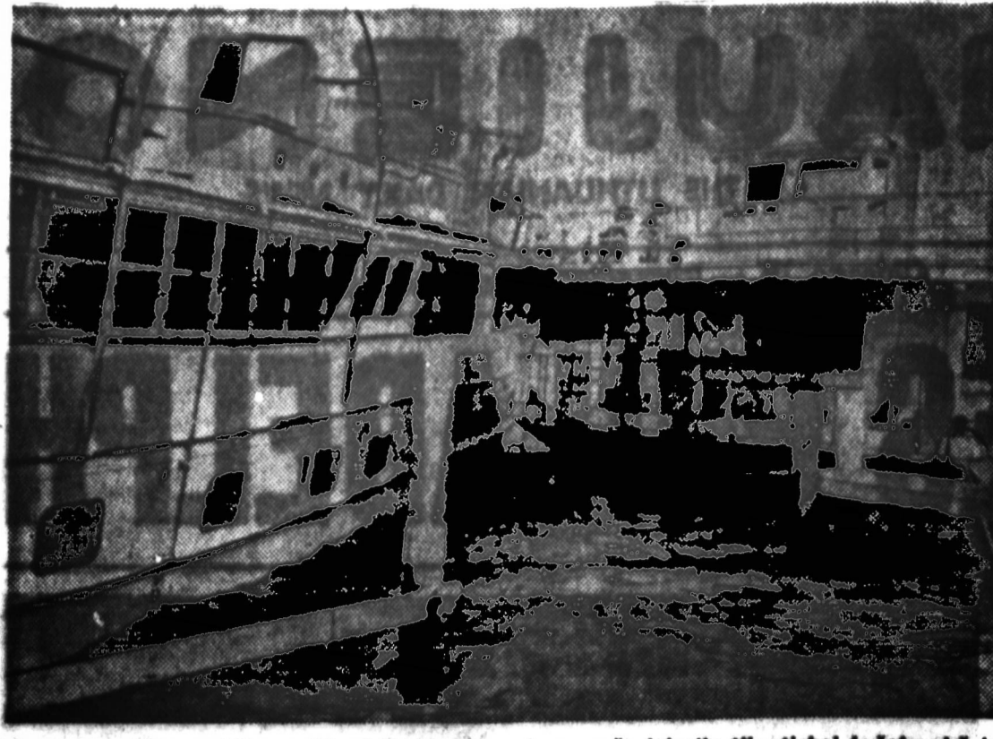
Kai uraganas Cleo pražibė pro Miami Beach, Fla., vieno mažo laivėlio tik stebai kykėjo virš bangų. Nuotraukoje matome gyvenamąjį laivą, taip pat nukentėjusį nuo uragano. Didesniojo laivo, kairėje, inkary grandinės buvo nutrauktos.

— Kai paklausai, kaip jiems sekasi, tai beveik kiekvienas pasigiria, kad dabar jau jiems lengviau, negu kad buvo tuo-