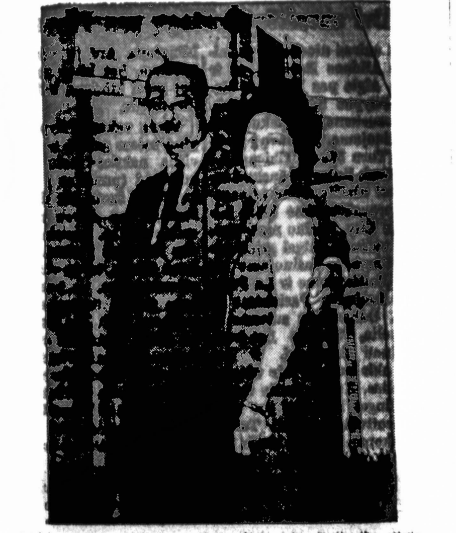
D. Girėno ir L. L. — Prezidentas su žmona, taip pat išvyko į sostinę trukti, ilais savo šlyje, esančiame netoli Johnson City, Teksaso.