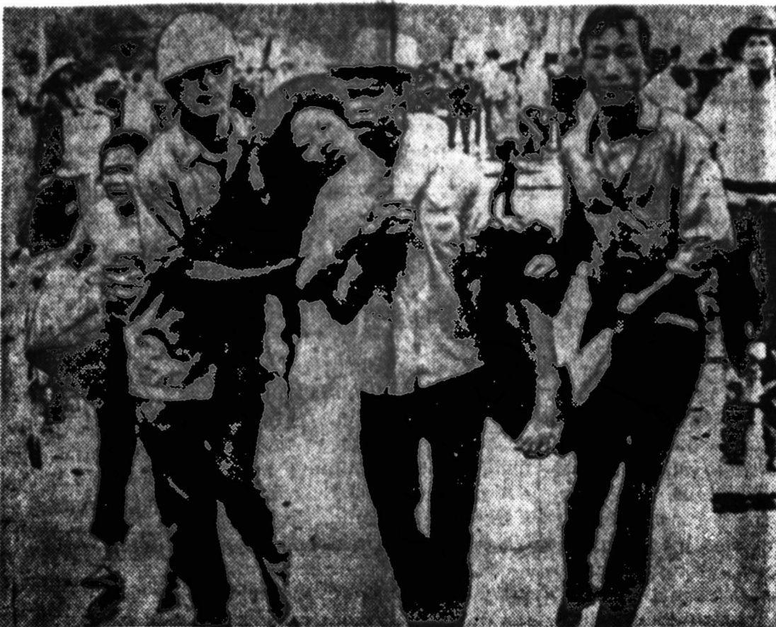
MINIA BUVO SUTIKTA SAUTUVŲ UGNIM. — Sužeista moteriškė nešama iš ugnies srities. Pietų Viet Nam kariai šaudė demonstrantų eilę, kai buvo vertinami pro Saigono Vyriausios Kariuomenės būstinės vartus.

— Pres. Johnson ketvirtadienį buvo nukrisęs į Winchester, Ga., ir dalyvavo sen. Harry F. Byrd žmonos laidotuvėse.