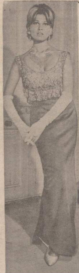
Paryžiaus madų specialistai pasiūvę paveiksle matomus drabužius jaunoms gražuolėms. Stambesnio sudėjimo moterims palieka gana plačius sijonus ir bliuskeles, bet viską labai jau susiaurina per kelius.