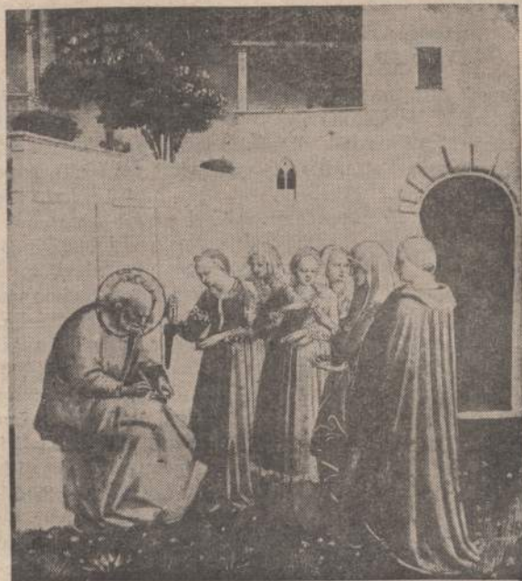
Fra Angelico kūriny

Rafaelis Sanzio iš Urbino gimė 1483, mirė 1520. Jo tėvas