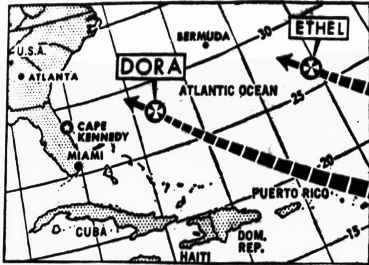
DVIGUBA GRESME. — Žemėlapis rodo uragano Doros kelią. Dora laikoma smarkiausiu šio sezono uraganu. Lyg to būtų maža, paskui Dora dabar seka naikinantis "bendrardis" — uraganas Ethel.