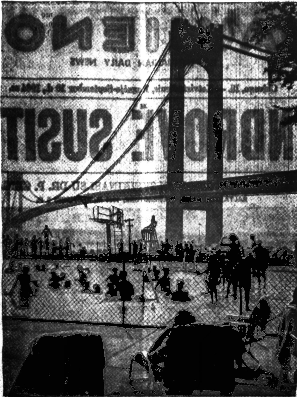
PO-TILTO SIŪNĖS. — Jau busik baigtas Verrazano tiltas, lungas Brooklyną ir Staten salą. Jis sudarė grąžį loms besimaudantiems. Pariz, Hamiltono baseine.

Pereitą savaitę paskelbiau apie lituanistinę šeštadieninę m-los prie šv. Antano parapijos mokslo metų pradžią. Kiek pavėluotai sužinojau, kad tą pačią, t. y. rugsėjo 12 d. mokslo metus pradeda ir pernai įsteigta Dr. V. Kudirkos vardo lituanistinė mokykla, vakariniame Detroito parkraštyje. Labai gerai, kad ta nauja mokyklėlė pernai neuždūso ir jau žengia į antruosius metus. Kai kurie ambicingi veikėjai darė viską, kad ji užtrokštų, bet tvirtas tėvų komitetas nepasidavė. Manau, kad dr. V. Kudirkos vardo mokykla jau šimet sustiprės naujais pirmokais, o per trejetą-ketvertą metų susilygins mokinių skaičiumi ir su šv. Antano m-la. Tuomet visi įsitikins, kad isteriskai keiktas