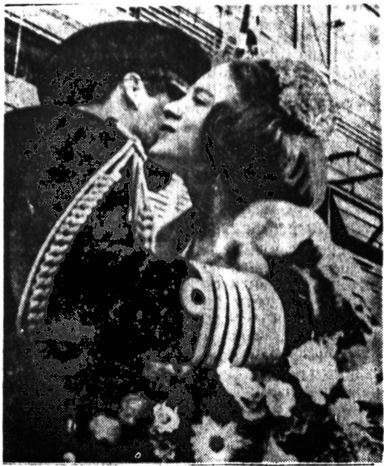
JĮ SUGRIEBĖ BUČKĲ. — Po vizito Kopenhagene Graikijos karalius Konstantinas, apleidamas Kastrupo aerodrome, bučiuoja savo sužadėtinę, Danijos princesę Anna-Marie prieš išlipdamas į lėktuvą, skrisiantį į Atėnus. Po keleto minučių princasė kitu lėktuvu išskrido į Brindisi (Italijoje). Iš ten ji įsiekė vyks į Graikiją. Karališkosios poros jungtuvės įvyks rugsėjo 18 d. Atėnuose.