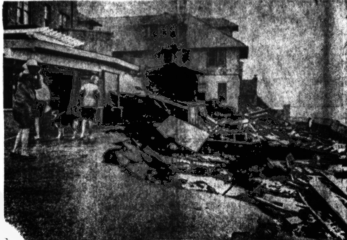
Jacksonville Beach (Fla.) vaizdas po praūžusio Doros uragano.

Vietos gyventojai nori autonomijos iš Italijos valdžios.