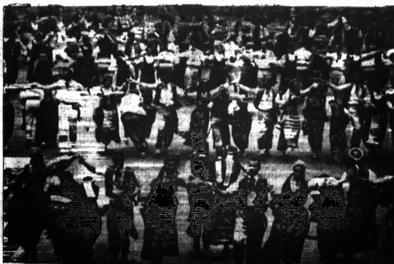
Iš visos Amerikos suvažiavęs lietuviškas jaunimas šoka lietuviškus tautinius šokius.

Veik kiekviename gatvės kampe Rytiniame Harleme rasi kilnojama kioskelį su "hot dogs". Stebėsi, kiek čia šioje gatvėje yra tokių žmonių, kurie perkasi savo tris valgius per dieną iš šio kioskelio, nuo to žmogelio, kurs