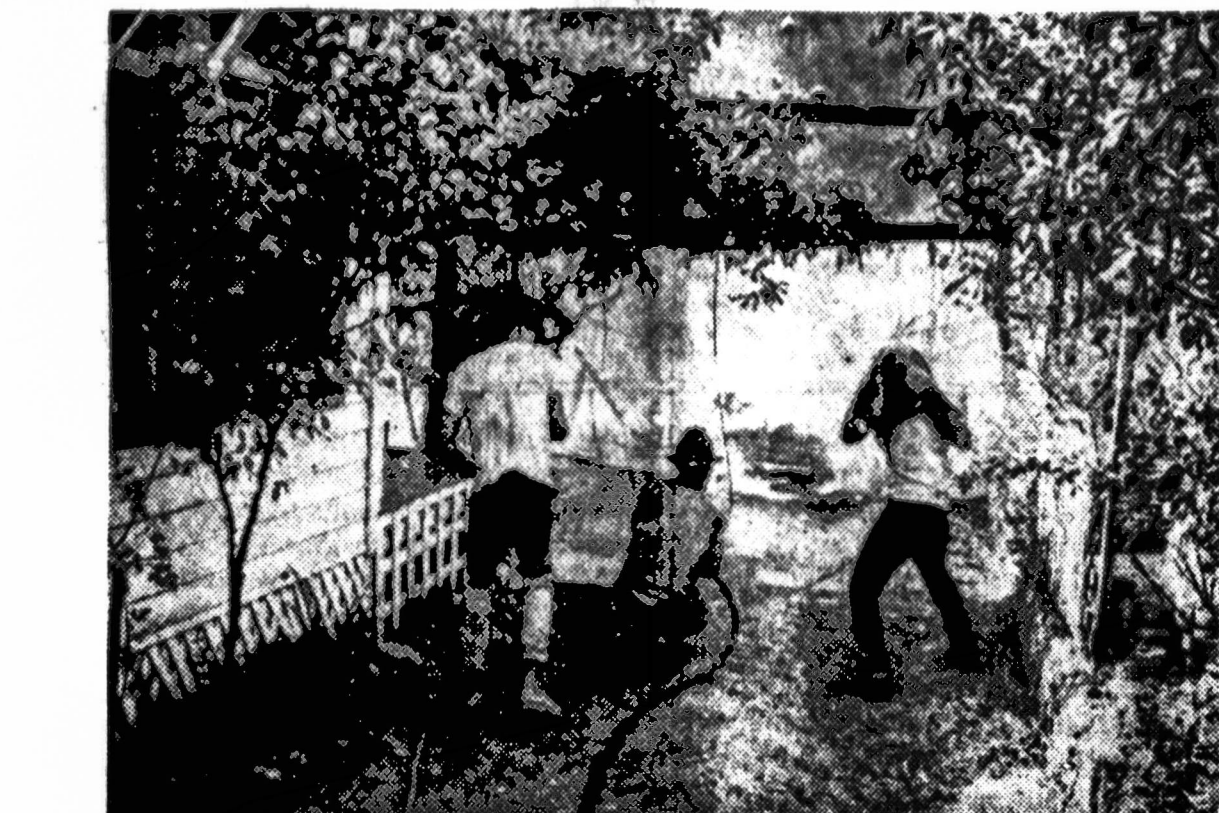
Agua Caliente srityje šilaisiais mėnesiais apsikarstę vyrai bando sustabdyti vis besiplečiantį kalifornijos gaisrą. Šiaurės Kalifornijos pakraščiuose gaisrai padarė labai didelių nuostolių. Namų savininkai iš anksto stengiasi savo pastoges apginti, bet didelėje sausroje tetai ne taip lengva padaryti. Paveiksle matome savininkus, pasiruošiusius ginti savo namus.

Prieš šitokią religinę laisvę supratimą pasisakė italų ir ispanų kardinolai, kurie remia vadinamąją valstybinę religijos sąvoką.