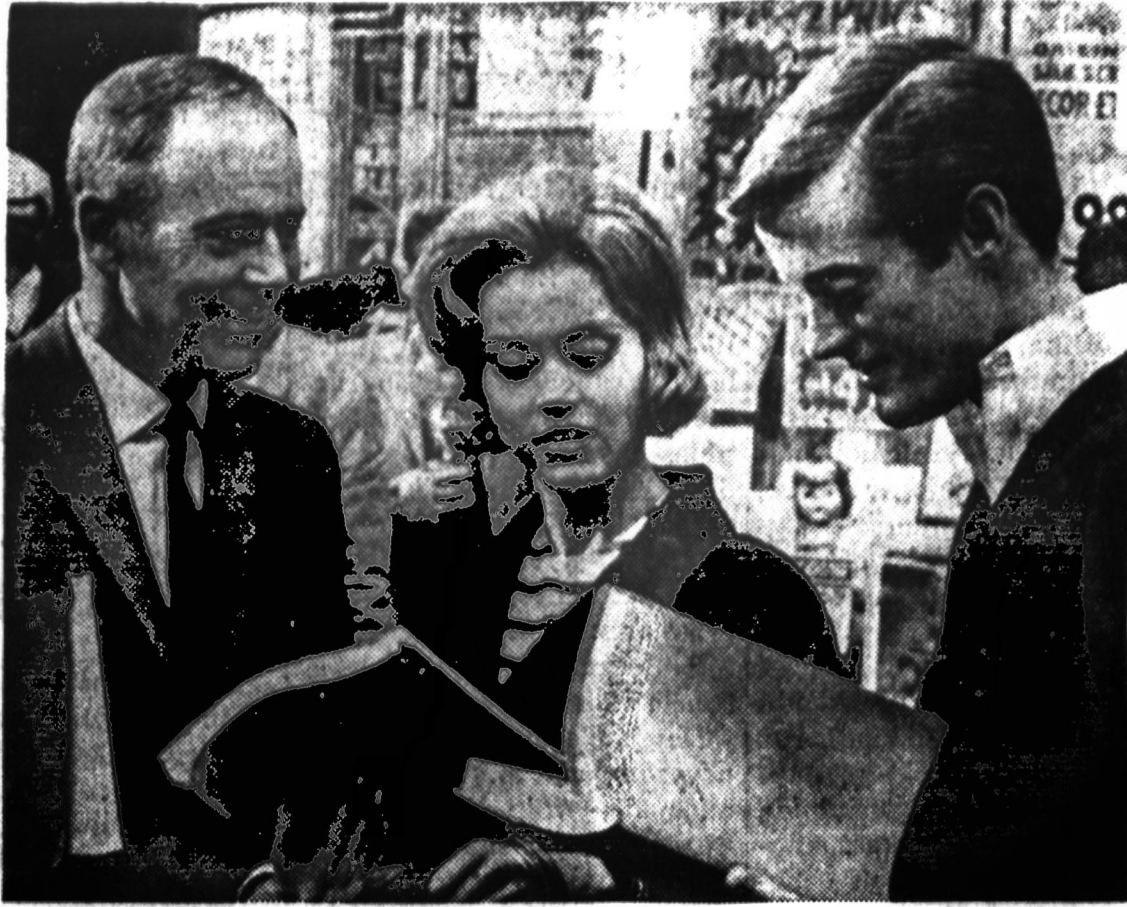
Ilgarsėjusi vaidintojų Fondų šeima. Paveiksle kairėje matome artistą Henry Fondą, jo dukrą Jane Fondą ir sūnų Peter Fondą. Tėvas susitiko su ilgarsėjusiais savo vaikais New Yorke.

Kadangi Dievas yra Meilė ir gėrio tobulybė, tai ir jo įstatymų vykdymas turi būti grindžiamas šitomis dorybėmis. Savo aukščiausiam kūriniumi žmogui Dievas įkvėpė laisvą valią elgtis savo protu, kurio pajėgumu taip pat nepašyktėjo. Be to, surašė ir laisvę gyventi, kurtis ir kurti darbo ir artimo meilėje. Tačiau žemės globėjas Liucipierius nerado reikalo taisyti žmonių klaidas gėriu ir meile, palinkęs į drausmę ir bausmę. Paskatiniui kūrybos darbą įkvėpė žmonėms pavydą lenktyniavimui, kas ilgainiui besiplečiant ir didėjant virto neapykantai ir kerštu žmonių tarpe iki broliudystės. Be to, ir pačiam Liucipieriumi kilo pavydas žmogui pasiekti dievytės laipsnio, dėl to, kad žmogaus siela yra aukštesnė už angelą ir gali įsikūnyti, kurios privilegijos neturi nei Arkangelas nei angelai.