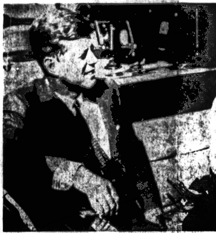
Tai bus bene paskutinė linksmo prezidento Kennedy fotografija, imta keliolika minučių prieš nužudymą. Sekmadienio vakarą Baltieji Rūmai paskelbė teisėjo Warren'o vadovautos komisijos raportą apie vi-galūnybę eiga ir tardymą. Komisijos nariai patalpo į šilkinimo, kad prezidentą nužudė vienas Lee Harvey Oswald.

Įvykių Dallas policijoj ir teis-mo pasižymėjo dideliu koresepondenų netvarkingumu, kuris daug prisidėjo ir prie Ruby nušovimo Oswald.