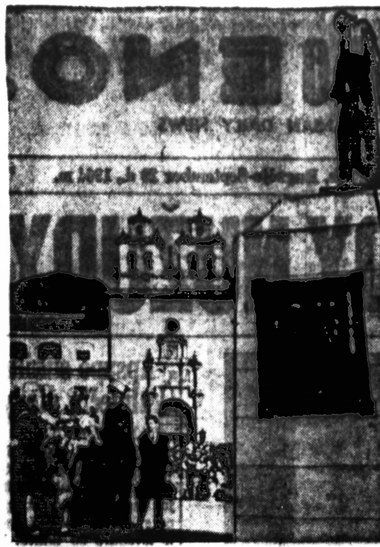
Katimilijus sostinėje prezidentas Charles de Gaulle padėjo valti prie Simono Bolivo paminklo. Prancūzijos prezidentas yra prastuoju 26 dienas praleisti Pietų Amerikoje ir aplankyti dešimt įvairių valstybių.