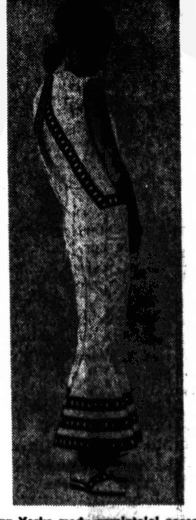
New Yorke mady gaminiojai pagamino ilius drabužius namie esantioms moterims.

VLIK (Vyriausiojo Lietuvos Išlaisvinimo Komiteto) naujai persiorganizavusios Tarybos posėdis įvyks š. m. spalio 3 d. New Yorke. Vliką dabar sudarys 15 grupių (politinių ir kitokių). Tame posėdyje bus renkama pirmininkas ir valdyba. Vykdomoji Taryba Vokietijoje pagal naują persitvarkymą panaikinama ir ten