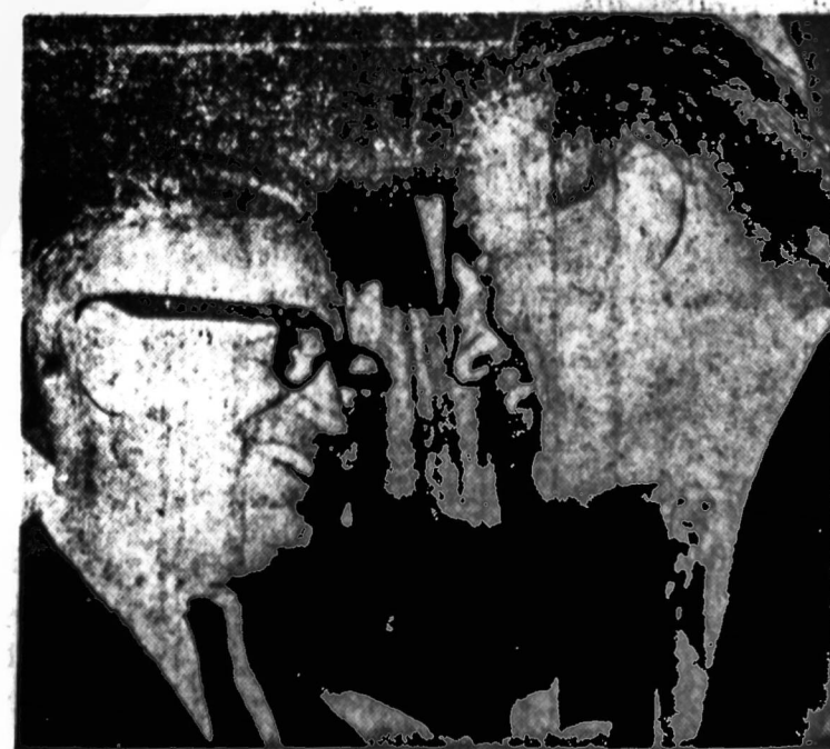
Michigan gubernatorių Romney nuvažiavo į Midland, Mich., miestelį, kur sen. Goldwateris tikinėjo gyventojus balsuoti už jį. Sen. Goldwater patarė balsuotojams taip pat rinkti ir gubernatorių, bet Romney labai nepatinkintas San Fransisco mieste pasakytą sen. Goldwaterio kalbą. Jis mano, kad respublikonų konvencija turėjusi pasibaigti kitomis nuotakomis.

Pareiškimą siūloma baigti vidujinius ginčus komunistų tarpe. Vienybė, esą, sustiprėtų, jei visi klausimai būtų sprendžiami lygybės ir abipusio pasitikėjimo dvasioje, draugiškai pasikeičiant nuomonėmis pagal Markso-Lenino principus.