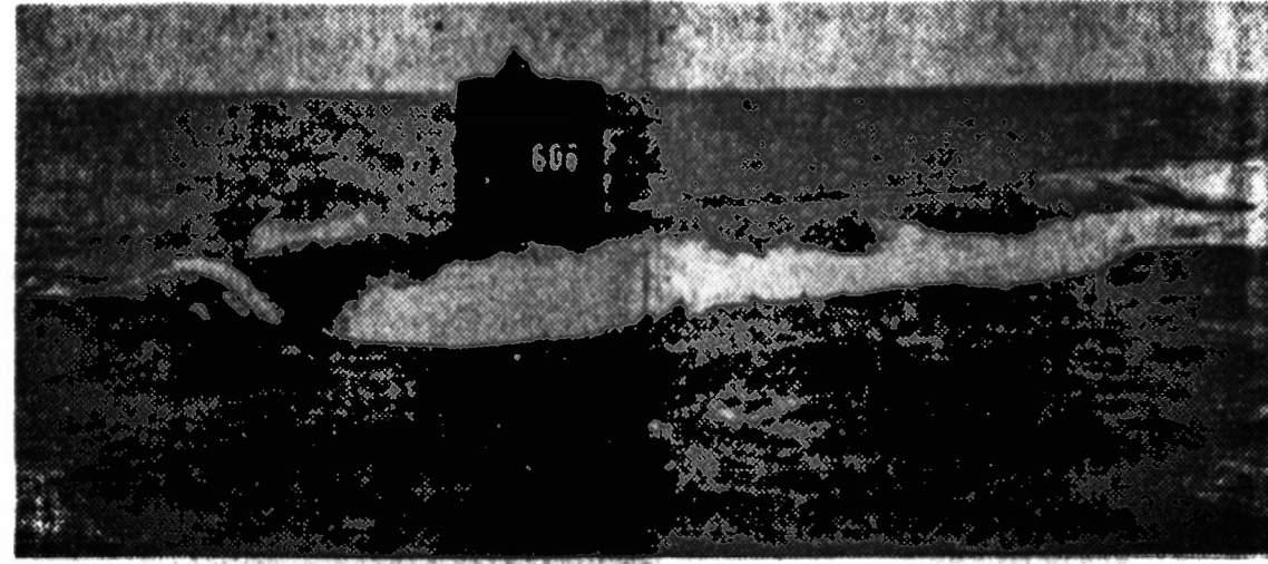
Bandomas naujas atomo energija varomas jėgdavlis "Tinos". Laivas sveria 4300 tonų, turi 12 karininkų ir 86 jūrininkus. Manoma, kad spalio 17 dieną jis jau bus paleistas plaukiojimui. Tai pirmas JAV toks jėgdavlis pastatytas puolimo tikslams.