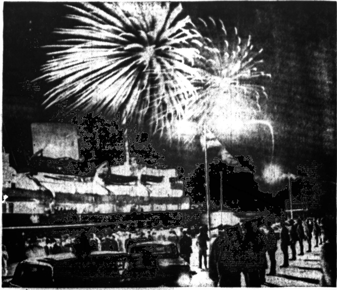
Karalienės Elžbietos jachta "Britannia" išplaukia iš Charlottetown uosto. Ją išlydėjo vietos gyventojai ir uosto pareigūnai. Į padangas buvo paleistos sprogstančios raketos.

NAUJIENŲ MAŠINŲ FONDAS, 1730 S. Halsted St., Chicago 8, Illinois NAUJIENŲ BENDROVĖ