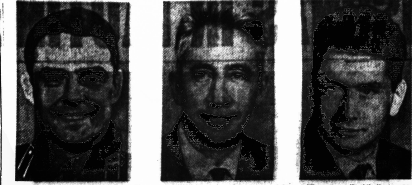
Sovietų rašytojas "Vieschud" kuravėnė rusai, li. kalba į dailinę meninę. 37 metų gėliu, Vladimirą M. Komarovą, 28 metų, liuanistinį, Konstantiną Pechotkiną ir 27 metų, anglas gydytoją, Boris Jurgovą. Jie skraidė 24 valandų aplink žemę ir orais nusileidė.