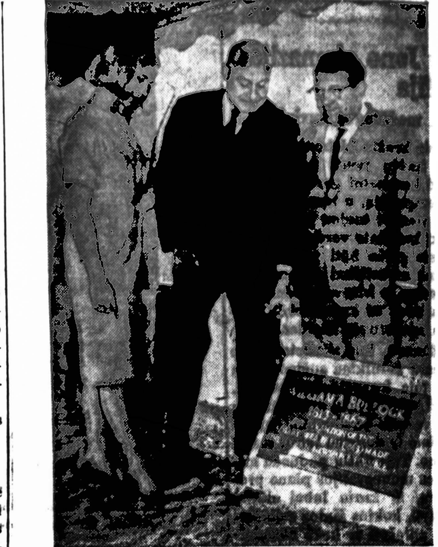
Dabar didžioji laikraščio vertėtojų rotacija web spausdinamąjį mašinos sugalvojo William Bullock. Pirmąkart tai buvo 1887 metais. Tačiau buvo Bismarck, šis laikas spaudos darbai dar buvo atlikti mašinos nepagalvoti priemonėmis. Tikrai dabar sukurti jo kopij, patvirtas ant jo paminklas ir atidėtas jam nuostabių spaudos mašinų išradėjų ir statytojų garbei.

skridimas buvo labai sėkmingas. Sovietų Sąjungai ir Nikita Chruščiov gavo milžinišką reklamą. Kokia nauda bus iš to Rusijos žmonėms, tai kitas klausimas. Bet ar Maskvos ponams tai rūpi??