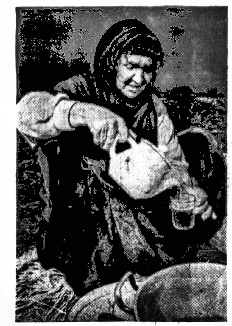
Čigonė valinėsi arbata Šveicarijoje. Paveiksle matoma moteris yra kilusi iš Arabijos. Kartu su dideliu šėnų karvanu ji keliauja per Šveicariją. Čigonai turėjo išvykti iš Šveicarijos, bet suėlavo. Kaip Arabijoje, taip Šveicarijoje, čigonai gyvena palapinėse ir arbata išsiverda lauke, prie susikurtos ugnelės.