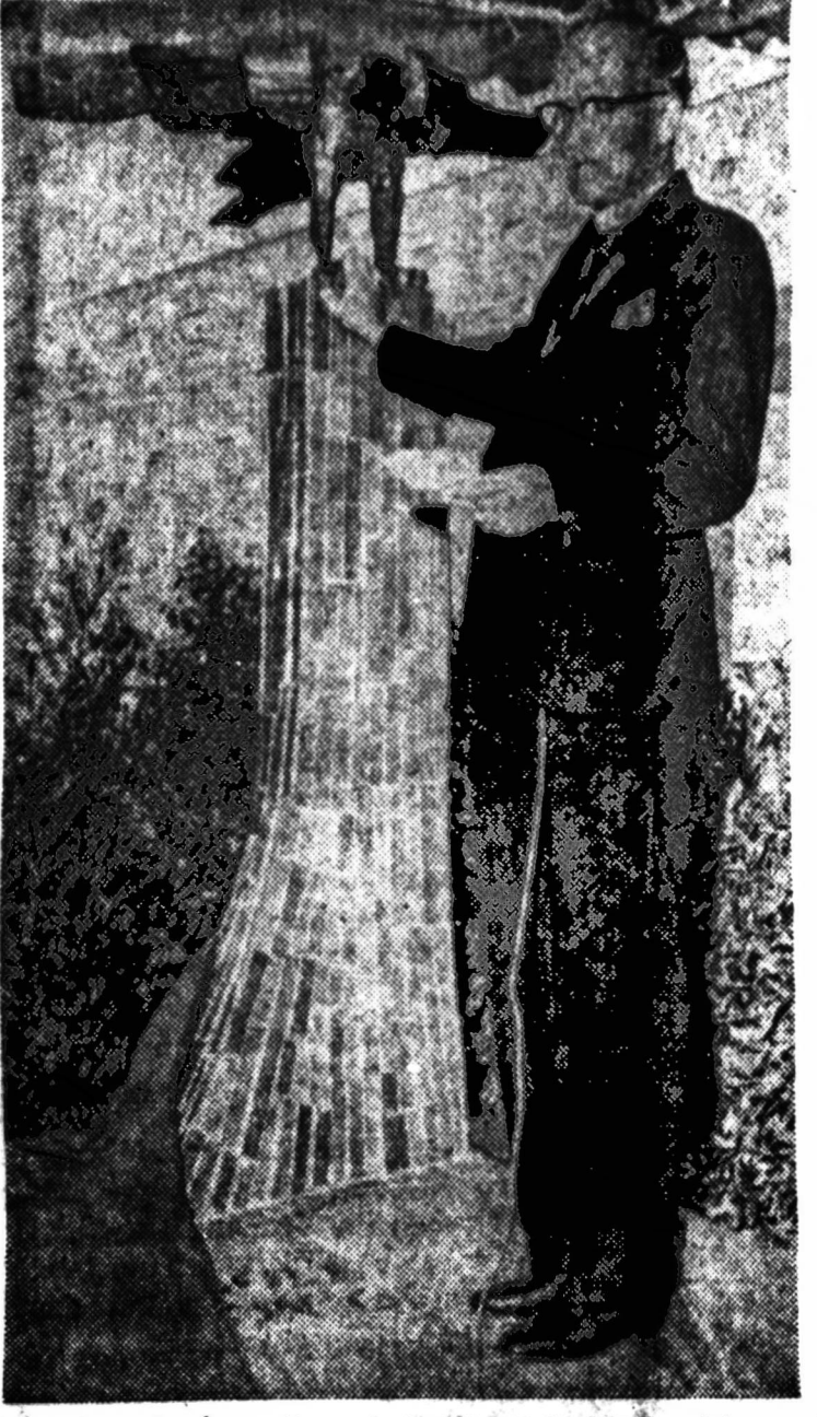
Dallas mieste, kur prez. Kennedy turėjo pasakyti kalbą, dabar pastatytas jo garbei paminklielis. Texas valstijos gyventojų daugumas pasipiktino prezidento nužudymu.

mėgsta sveikintis ir kalbėtis su žmonėmis. Jo dešinė ranka po kelionės vakarinėse valstijose esanti visa žaizdota ir skaudanti nuo tūkstančių paspaudimų. Trys pirštai yra aprišti. Dabar prezidentas vartoja sveikinimuisi katriją ranką.