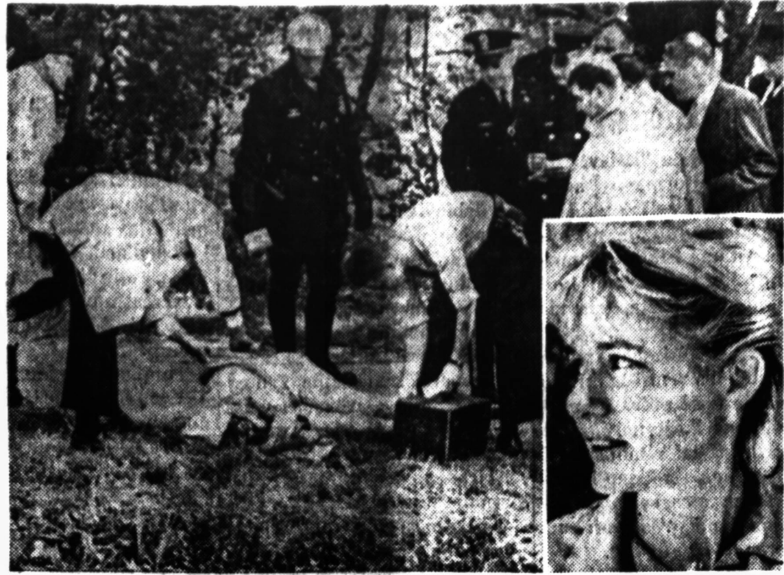
Policija apžiūrinėja Mary Pinchot Meyer lavoną, rastą netoli Washingtono, D. C., Ohio kanalo pamiškėse. Mary Pinchot buvo nužauta. Policija įtarė vieną netoliese dirbusių laukų darbininką. Mrs. Mary Pinchot buvo gera Jacqueline Kennedy draugė. Jodvi dažnai šioje apylinkėje vaikščiodavo.

Po penkių K. Donelaičio mokyklos darbo metų labai išriškėjo ir tos programos taisytinos vietos. Pirmiausia, vieniems mokslo metams nustatytas kursas buvo lengvai užbaigiamas ir, dar gerokai prieš mokslo metų pabaigą, ir pavašarį buvo galima pradėti net sekančių mokslo metų programą, ką kai kurie mokytojai ir darydavo. Tai praktiškai įrodė, kad ištiesi einant lituanistinę programą per tris mokslo