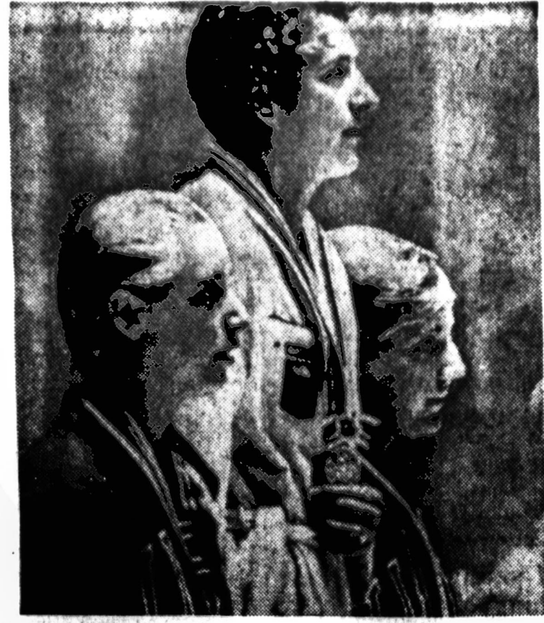
Australitė Dawn Fraser, olimpinioje žaidimuose laimėjusi 100 metrų lenktynes. Greita jos stovi kitos dvi greičiausios moterys, bėgusios įkandį australitės.

Susirinkimui, kuris įvyko milžiniško Sheraton-Chicago viešbučio patalpoje, atsiuntė ilgą linkėjimų telegramą prezidentas Johnson, apgailestau-