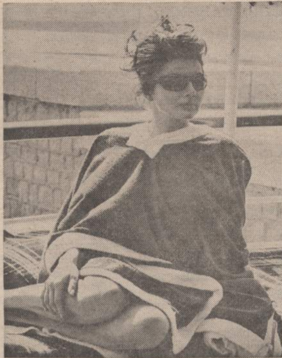
Gražioji Irano karalienė Soraya dabar tapo artistė. Ji vaidina svarbiausią rolę filmoje "Trys moters veidai". Paveiksle ji laukia savo eilės, kai turės stoti prieš žviesas ir filmų kameras.