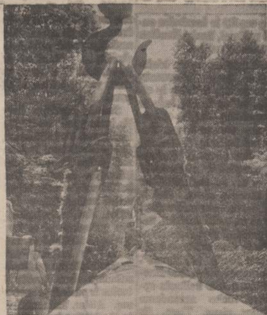
Tiesia vamzdžius gazui siūsti. Paveikslas imtas Washingtono miškuose. Traktorius miškais prakasa griovį, o kiti kranai įleidžia didelius plieno vamzdžius.