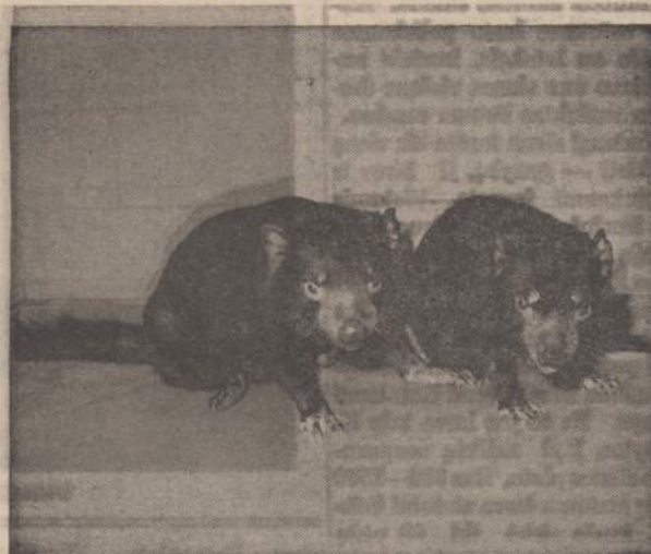
TASMANIJOS VELNIAI LINKOLNO PARKE

Taigi, kiniečiai susidūrė ir su transporto problema, kurią jie lengvai išsprendė žmonių mase, nes Kinijoje darbo jėgos niekuomet netrūko. Viskas buvo gabenama ant žmonių pečių neštuvais. Bambuko lazda buvo permetama per pečius, o ant abiejų lazdos galų buvo pakabinami krepšiai su transportuojama medžiaga. Panašus būdas buvo vartojamas ir Lietuvos kaime vandeniu nešti (naščiai). Dar ir šiandien Kinijoje ir kitur Toluosiuose Rytuose šis metodas yra labai dažnai užtinkamas. Tik jau labai kalnuotose vietose kiniečiai transportui vartojė specialiai tam tikslui apmokytas kalnų ožkas. Plytų surišimui jau tuomet Kinijoje buvo vartojamos kalkių, smėlio ir vandens skiedinys. Tarp abiejų